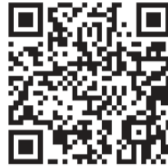
રોબોટને જીવંત જોવા માટે QR Code સ્કેન કરો