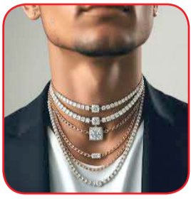
છે. માત્ર ગોલ્ડ કે સિલ્વર જ નહીં પણ બંને ટોનની ચેઈન એક્સાથે પહેરવી પણ ફેશન માનવામાં આવે છે.