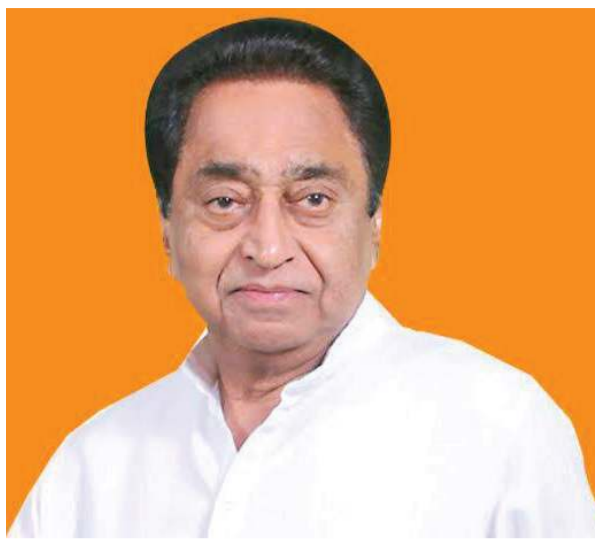
ઈધર-ઈધરકી આરતી જેરથ

ત્યારબાદ 75 વર્ષીય રાજસ્થાનના ભૂતપૂર્વ મુખ્યમંત્રી અશોક ગેહલોત છે જે 2028 ની વિધાનસભા ચૂંટણીમાં સચિન પાયલટના મુખ્યમંત્રી ચહેરા તરીકે પાર્ટીનું નેતૃત્વ કરવા માટે પાછા આવવાની સંભાવનાને તોડવાનો પ્રયાસ કરી રહ્યા છે. તેમણે 2020 ના મધ્યમાં અચાનક પાયલટના બળવાને ફરીથી જીવંત કર્યો જ્યારે નાના નેતાએ અસંતુષ્ટોના એક જૂથ સાથે ગેહલોતની સરકાર લગભગ પાડી દીધી હતી. તેમને શાંત પાડવામાં આવ્યા અને બાદમાં મુખ્યાલયમાં એક પદ આપવામાં આવ્યું અને આ વચન આપવામાં આવ્યું કે જો કોંગ્રેસ 2028 માં જીતશે તો તેઓ મુખ્યમંત્રી બનશે. ગેહલોત તે ટૂંકા ગાળાના બળવાની યાદોને તાજ કરીને પાયલટની વફાદારી પર પ્રશ્ન ઉઠાવવાનો પ્રયાસ કરી રહ્યા છે. તેમના સમર્થકો સોશિયલ મીડિયા પર એવી પોસ્ટ્સ ભરી રહ્યા છે જેમાં પાયલટને જાહેર કરવાની માંગ કરવામાં આવી રહી છે કે ગેહલોત સરકારને તોડી પાડવા માટેના તેમના પ્રયાસોને કોણે ભંડોળ પૂરું પાડ્યું હતું. એ સ્પષ્ટ છે કે ગેહલોત રાજસ્થાનમાં પેઢી દર પેઢી થઈ રહેલા નેતૃત્વ પરિવર્તનને રોકવા માંગે છે. ભૂતપૂર્વ મધ્યપ્રદેશના મુખ્યમંત્રી દિગ્વિજય સિંહ એકમાત્ર એવા છે જેમણે નિવૃત્તિ લેવાનું પસંદ કર્યું છે. તેમનો રાજ્યસભાનો કાર્યકાળ જૂનમાં સમાપ્ત થાય છે પરંતુ તેમણે તેમને ફરીથી નોમિનેટ ન કરવાના અને નટરાજનને સત્તા સોંપવાના તેમના પક્ષના નિર્ણયને ઉદારતાથી સ્વીકાર્યો.