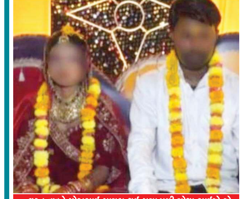
લગ્ન વખતે મોટાભાઈ ગાયબ થઈ ગયા પછી ચોથા ભાઈએ એ કન્યા સાથે લગ્ન તો કર્યા, પણ પછી...

એક ...દો...તીન.. ચાર... આજ પિયા કરું તેરા ઈન્તઝાર !