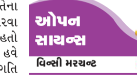
ઓપન સાયન્સ વિન્સી મરચન્ટ

એક તરફ બાળમરણનું પ્રમાણ નેત્રદીપક રીતે ઘટ્યું છે. જો મા-બાપને ખાતરી હોય કે બધા બાળકો જીવીને ટીનેજર કે યુવાન બની જશે તો તેઓ વધારે બાળકો પેદા કરતાં નથી. આવી એક દલીલ આપવામાં આવે છે પરંતુ તેમાં વધુ દમ દેખાતો નથી. હા, એ ખરું કે ગર્ભનિરોધક સાધનો અને ઉપાયો વધ્યા છે તેથી પણ જન્મનું પ્રમાણ ઘટ્યું છે. ભારતના 36 ટકા બાળકો આજે ફી વસુલતી ખાનગી શાળાઓમાં