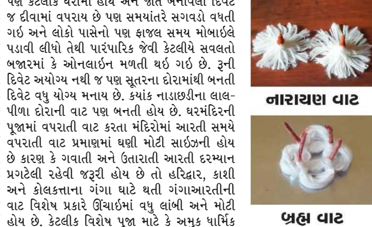
નારાયણ વાટ, શિવ પાર્વતિ વાટ, ડમરું વાટ, મોગરા વાટ, પંચતત્ત્વ વાટ, પ્રહ્લા વાટ, સહસ્ત્ર વાટ, ત્રિશુભ વાટ, ત્રિપુર વાટ, રૂદ્રાક્ષ વાટ

આપણા પૂજાધરમાં સામાન્ય રીતે ગોળ ઊભી વાટ વાપરીએ છીએ. એક જાણકારી મુજબ આ ગોળ ઊભી વાટના દીવા માટે ખાસ પ્રકારની વાટના દીવા પ્રગટાવવામાં આવતા હોય છે. આવી વિશેષ પ્રકારની વાટના નામ પણ વિશેષ હોય છે. 'શિવરાત્ર વાટ' 1100 દોરાની બનતી હોય છે જે શિવરાત્રી કે મહાશિવરાત્રીના અવસરે ઘીમાં ઝબોળી પ્રગટાવાય છે. અહીં 1100 દોરાની વાટ આવી તો સૂતરના ખૂબ જ પતલા અનેક દોરાઓથી એક દોરો બનતો હોય છે. જેની ગણતરી વાટ બનાવનારને હોય છે એટલે એવા કેટલાક દોરાઓ થકી 'શિવરાત્ર વાટ' બનતી હોય છે. એક જ 'વૈકુંઠ વાટ' જે 350 દોરામાંથી એક વૈંત લંબાઈની બનાવાય છે. વૈકુંઠ ચતુર્દશીના અવસરે આ વાટના દીવાની આરતીનો ઉપયોગ થતો હોય છે. 'તિપુરવાટ'એ 365 દોરાથી બનેલ જાડા ત્રણ દોરાથી બનતી વાટ છે. જે ત્રિપુરાની