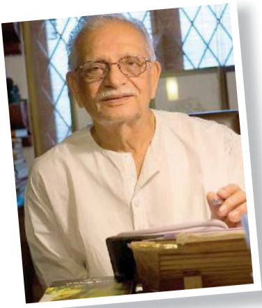
મિકેનિક કેવી રીતે બન્યો કવિતાનો શહેનશાહ? Pg.2