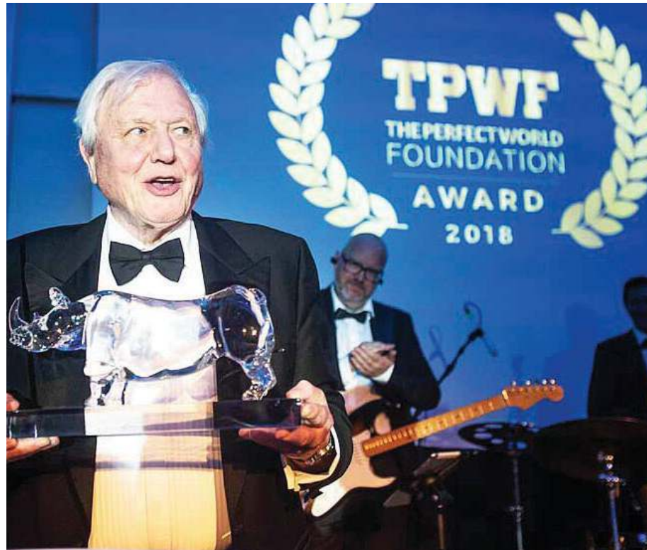
એટનબરોની એવી અનેક સિદ્ધિ છે જે સ્વખવત લાગે. જેમ કે, વીસ જેટલાં પ્રજાતિના નામોમાં એટનબરોનું નામ આપવામાં આવ્યું છે અને તેમને અત્યાર સુધી બ્રિટનની જુદી જુદી યુનિવર્સિટીઝમાંથી 32 જેટલી માનદ ડિગ્રી મેળવી છે

'ગાંધી' ફિલ્મનું નિર્માણ કરનારા ખ્યાતનામ ડિરેક્ટર રિચાર્ડ એટનબરો તેમના ભાઈ છે. તેમના એક અન્ય ભાઈ જોહન એટનબરો મોટર ઈન્ડસ્ટ્રીઝમાં ગણનાપાત્ર નામ છે. એટનબરો પરિવારની બીજી પેઢી પણ અનેક ક્ષેત્રોમાં યોગદાન આપી રહી છે. અદ્વિતિય લાગતી ડેવિડ એટનબરોની યાત્રાની શરૂઆત 'બીબીસી'ના જુદા