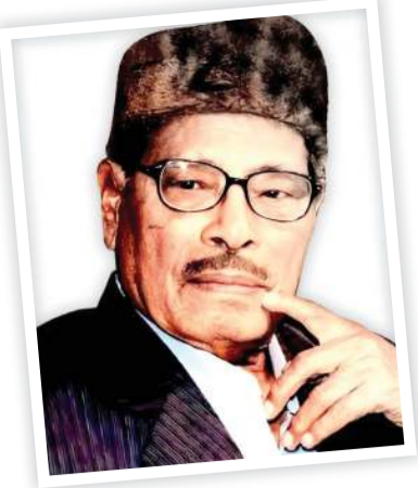
પંચમ દાએ મળ્યા કે માટે ગીત બનાવ્યું પણ કિશોર દાએ... Pg.2