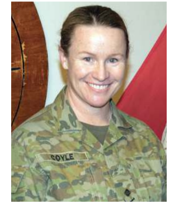
કોણ છે લેફ્ટનન્ટ જનરલ સુસાન કોયેલ?

ભારતીય લશ્કરના આ બધાં મહિલા અધિકારીઓને યાદ કરવાનું કારણ એ કે હમણાં થોડા સમય પહેલાં એક સમાચાર ધ્યાનમાં આવેલા કે ઓસ્ટ્રેલિયાનું લશ્કર જુલાઈ, 2026માં લેફ્ટનન્ટ જનરલ સુસાન કોયેલની નિમણૂક પહેલી વાર લશ્કરી વડા એટલે કે આર્મી ચીફ તરીકે કરવા જઈ રહ્યું છે. ઓસ્ટ્રેલિયાના અત્યાર સુધીના લશ્કરી ઇતિહાસમાં આ એવી પ્રથમ ઘટના હશે કે જ્યારે એક મહિલા લશ્કરી અધિકારીની નિમણૂક આર્મીની સર્વોચ્ચ થી સ્ટાર રેન્કમાં થઈ