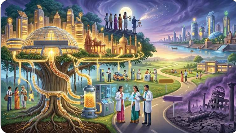
આગામી વર્ષોમાં સુગર વિષાદનું નહીં આશીર્વાદનું કારણ બની રહેશે...!

મા ઘણા સંશોધનો દ્વારા સુખની ક્ષિતિજો કેવી રીતે પાર કરી શકે છે તેનું પ્રમાણ હાલ એક મેગેઝિનમાં પ્રગટેલી માહિતીમાંથી મળ્યું. અમેરિકામાં થયેલા એક સંશોધનને આપરી ઓપ અપાર્થ રહ્યો છે. ત્યારબાદ તે સુખનો સંદેશો લઈને સમગ્ર વિશ્વમાં છવાઈ જશે. (એમ કહીએ કે સુખની ખબર પાદરે આવી ગઈ છે. બસ સુખી થવાને આડે હવે માત્ર થોડી વાર છે.) આપને આશ્ચર્ય થશે પણ બહુ ટૂંક સમયમાં શરીરમાં ઉત્પન્ન થતી સુગરનું અન્ય ઊર્જામાં રૂપાંતર થઈ શકશે. અર્થાત્ સુગરના રોગનો નવરચનાત્મક માર્ગ વિનિયોગ કરી શકાશે.