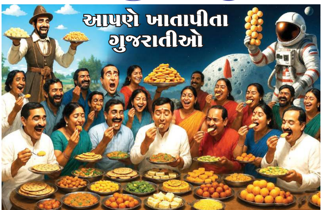
ટાઈટલ્સ : વિચાર છોડો, વાનગી માણો (છેલવાણી)

મોટા છે કે સાચાં. ન્યાયાલયો મંદ ગતિએ કાર્યરત છે અને આ મુદ્દામાં હસ્તક્ષેપ કરવામાં ખચકાટ અનુભવે છે. અપવાદોને છોડી દઈએ તો મીડિયા પણ આ પ્રકારના હુમલાઓને દબાવી દે છે અથવા તો તેનું દેખાડવાનું પ્રમાણ ઓછું છે. રાજકીય અને ધાર્મિક આગેવાન તેને યોગ્ય ઠેરવવા માટે દલીલો કરે છે. રાજમોહન ગાંધી દેશમાં હિન્દુ-મુસ્લિમ વિખવાદની ઘટનાઓ ટાંકી છે તેમાં ક્યાંક બાળકો પણ શિકાર થયા છે. માનવી તરીકે આપણી નીચેની પાયરીએ ઉતરી રહ્યા છે તે તરફ તેમનો નિર્દેશ છે. આ મુદ્દો સમજાવવા અર્થે તેઓ રાજમોહન ગાંધી તેમના દાદા અને દેશના રાષ્ટ્રપિતા ગાંધીજીનો એક દાખલો ટાંકે છે. તેઓ લખે છે કે, 'ગાંધીજીએ પોતાની આત્મકથા સત્યાના પ્રયોગોમાં 1894ની એક ઘટનાનો ઉલ્લેખ કર્યો છે. જ્યારે તેઓ 24 વર્ષના વકીલ હતા અને દક્ષિણ આફ્રિકાના ડરબન શહેરમાં વસવાટ કરતા હતા ત્યારે એક તમિલ ભાષી મજૂર બાલાસુંદરમ્, જેને તેના ગોરા માલિકે માર મારીને અધમૂઓ