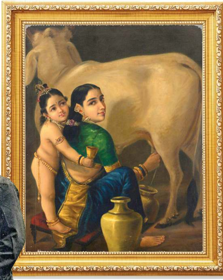
રવિ વર્માની સૌથી મોટી વિશેષતા એ હતી કે તેમણે ભારતીય વિષયોને પશ્ચિમની વાસ્તવિક ચિત્રશૈલી સાથે ગૂંચ્યાં. પ્રકાશ-છંદો, ચહેરાના ભાવ, વસ્ત્રોની નાજુક સળવળ, આભૂષણોની ઝગમગ- તેમના કેનવાસ પર બહુ જીવંત લાગે છે

ક ચિત્રની કિંમત કેટલી હોઈ શકે? લાખો? કરોડો? પણ જ્યારે 130 વર્ષ જૂનું એક ચિત્ર લગભગ રૂ. 167. 2 કરોડમાં વેચાઈને નવો રેકોર્ડ સર્જે, ત્યારે આ આંકડો માત્ર બજારમૂલ્ય નથી રહેતો; તે સંસ્કૃતિના મૂલ્યમાં રૂપાંતરિત થઈ જાય છે. તાજેતરમાં રાજા રવિ વર્માનું એક ઐતિહાસિક ચિત્ર રેકોર્ડ કિંમતે વેચાયું અને ફરી એક વાર આખા દેશની નજર આ મહાન ચિત્રકાર પર જઈ અટકી. ઉદ્યોગપતિ સાર્ડરસ એસ. પૂનાવાલાએ 'યશોદા અને કૃષ્ણ' નામના ચિત્રને રેકોર્ડ કિંમતે ખરીદ્યું હતું. તે સાથે આ ચિત્ર અત્યાર સુધીની સૌથી મોંઘી ભારતીય કલાકૃતિ બની ગયું છે.