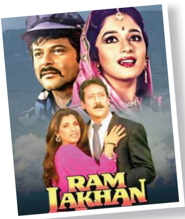
બોલિવુડને કેવી રીતે મળી બ્લોકબસ્ટર 'રામ લખન' ? Pg.2