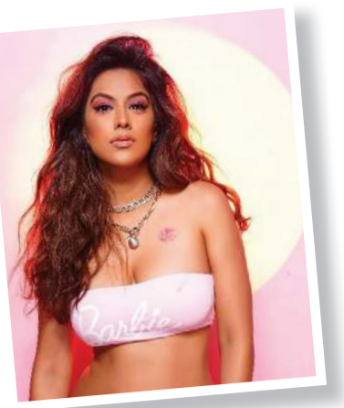
નિયાને શું વધુ પસંદ છે, ગ્લેમર કે એક્ટિંગ? Pg.4