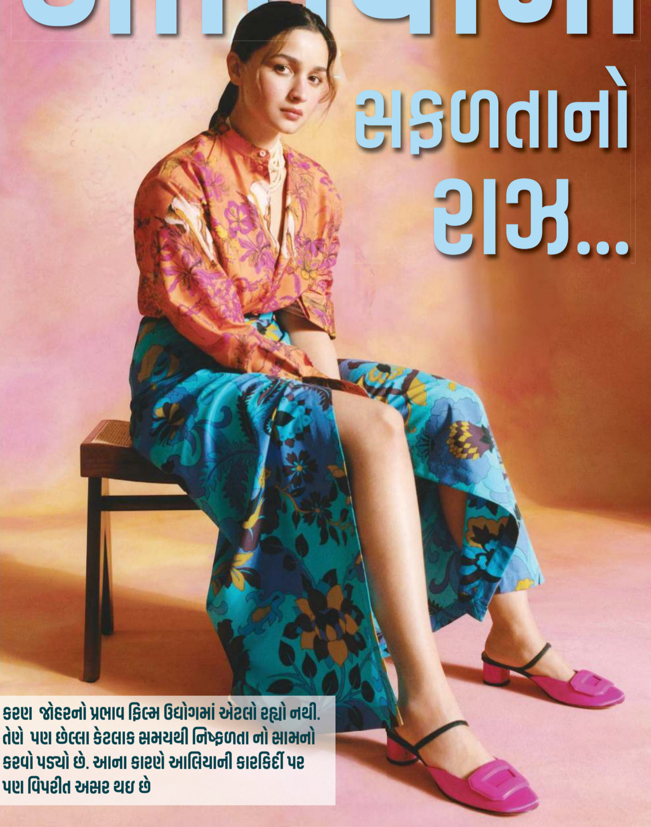
કરણ જોહરનો પ્રભાવ ફિલ્મ ઉદ્યોગમાં એટલો રહ્યો નથી. તેણે પણ છેલ્લા કેટલાક સમયથી નિષ્ફળતાનો સામનો કરવો પડ્યો છે. આના કારણે આસિયાની કારકિર્દી પર પણ વિપરીત અસર થઈ છે