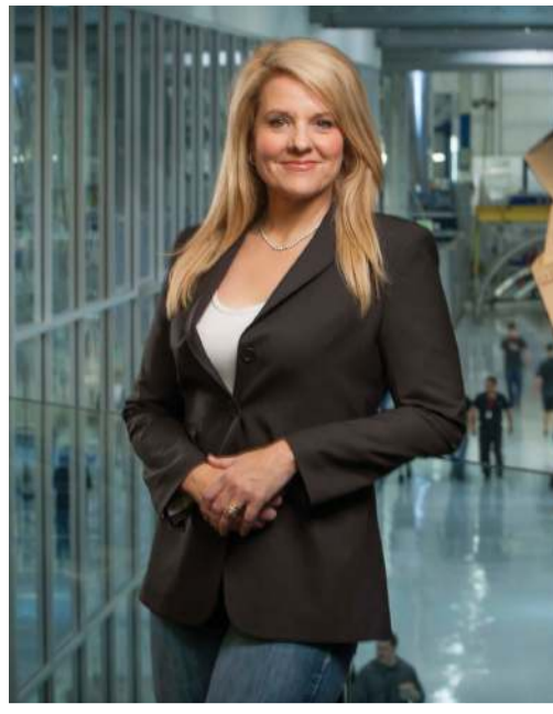
સુધી પુરુષપ્રધાન રહ્યો છે. અવકાશ ઉદ્યોગમાં કામ કરવું સહેલું નથી; તેમાં દીર્ઘદ્રષ્ટિ, વર્ષોનું આયોજન, વિશાળ રોકાણ અને નિષ્ફળતાઓમાંથી શીખવાની ક્ષમતા જોઈએ. શોટવેલે વારંવાર સાબિત કર્યું છે કે તે માત્ર વર્તમાન નહીં પરંતુ ભવિષ્યને ધ્યાનમાં રાખીને નિર્ણયો લે છે. આ ગુણ ભારતીય યુવાઓ માટે ખાસ મહત્વપૂર્ણ છે કારણ કે આજની ઝડપી દુનિયામાં ધીરજ અને લાંબા ગાળાની વિચારસરણી ઘણી વાર ઓછી જોવા મળે છે. શોટવેલે પોતાના કાર્યથી સાબિત કર્યું કે પ્રતિભા અને સમર્પણ સામે કોઈ અવરોધ ટકી શકતો નથી. ભારતમાં પણ રિતુ કરીધાલ અને મુથેયા વનિતા જેવી મહિલાઓ આ બદલાવનું પ્રતીક છે પરંતુ તેમની વાર્તાઓને વધુ વ્યાપક રીતે પહોંચાડવાની જરૂર છે.

તેણે નાસા જેવી પ્રતિષ્ઠિત સંસ્થાઓ સાથે મહત્વપૂર્ણ કરારો કર્યાં હતા, જે કોઈ નવી કંપની માટે જીવનદાન સમાન હોય છે. આ રીતે તેણે સાબિત કર્યું કે માત્ર ટેકનિકલ જ્ઞાન પૂરતું નથી પણ વ્યાવસાયિક સમજ અને વાટાઘાટો કરવાનું કૌશલ્ય પણ એટલાં જ જરૂરી છે. શોટવેલનું જીવન મહિલાઓ માટે ખાસ પ્રેરણા સમાન છે. તેણે એવા ક્ષેત્રમાં પોતાની ઓળખ ઊભી કરી, જે લાંબા સમય