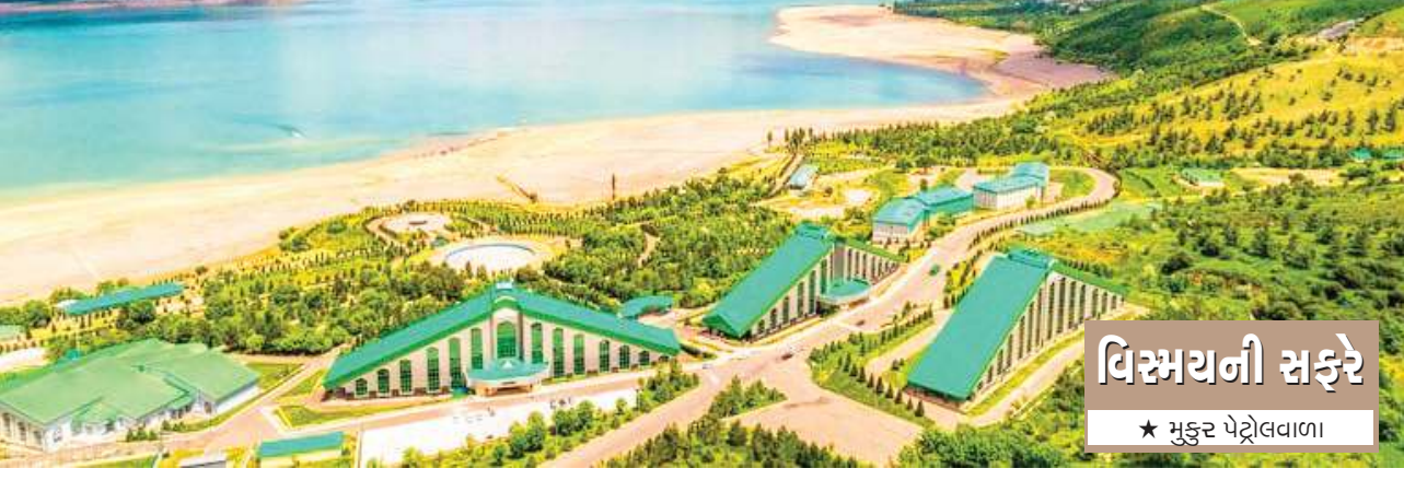
વિસ્મયની સફરે ★ મુકુર પેટ્રોલવાળા

અબેકિસ્તાનમાં, અમે પહેલાં જોયેલા દેશો - કઝક અને કિર્ગિસ્તાન જેવું કુદરતી સૌંદર્ય નથી. એ મોટા ભાગે સપાટ મેદાન અને રણથી ભરેલો છે એટલે જ કદાચ ત્યાંના સમરકંદ - બુખારા લડવૈયા માટે જાણીતા બન્યા અને અમારી ત્યાંની મુસાફરી ઈતિહાસની ગલીઓમાં અમને લઈ ગઈ પછ એ આખા રણ પ્રદેશમાં ‘ઓએસિસ’ - વીરડી સમાન જગ્યા હોય તો તારાકંતથી બે કલાકના અંતરે આવેલ પશ્ચિમી ટિયેન શાન પર્વતમાળાનો ચીમગન માઉન્ટન. સમરકંદથી ૫૬ ક્યાં પછી અમારે આ મીઠી વીરડી સમાન પ્રદેશની મુલાકાત લેવાની હતી. અમારા ગાઈડ આવી ગયા હતા. એ વયોવૃદ્ધ સોવિયેત આર્મીના રિટાયર્ડ સૈનિક હતા અને સૈનિકને છાજે એમ ટટ્ટાર અને શિસ્તબદ્ધ વર્તન કરતા. આમ અમને ટૂરમાં જાત જાતના ગાઈડનો અનુભવ થયો - અલ્પાટીમાં