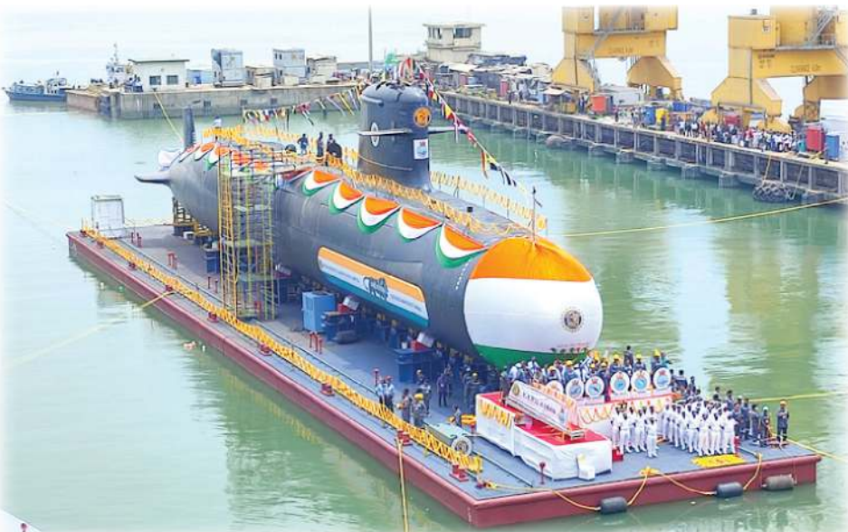
ટેકનોલોજીવાળી સબમરીન સામેલ કરવાનું આરંભાયેલું અભિયાન છે. 2025માં આ ટેકનોલોજી સાથેની સબમરીનનું ટેસ્ટિંગ થતું રહેશે અને 2026માં આ ટેકનોલોજી સાથેની સબમરીન ભારતીય નૌકાદળમાં

આ વખતે અહીં જે વાત કરવી છે તે સંદર્ભે બેટલ ઓફ એટલાન્ટિક ચોક્કસપણે યાદ આવે છે. સપ્ટેમ્બર, 2025માં બીજા વિશ્વયુદ્ધને 80 વર્ષ પૂરાં થશે. આ તબક્કે બેટલ ઓફ એટલાન્ટિકનો એકદમ ટૂંકો પરિચય કરીએ. આમ તો આ બેટલ વિશે જ એક અલગ લેખ થાય, જે આવનારા સમયમાં ક્યારેક કરીશું પણ ખરા. જો કે હાલ તો આ લેખના વિષય પૂરતો અહીં ઉલ્લેખ કરીને આગળ ચાલીએ. બેટલ ઓફ એટલાન્ટિક બીજા વિશ્વયુદ્ધ દરમ્યાનની જળ મોરચાની સૌથી મોટી લશ્કરી કાર્યવાહી છે. આ લશ્કરી કાર્યવાહીનો સત્તાવાર સમયગાળો 1939થી 1941નો છે. બીજું વિશ્વયુદ્ધ શરૂ થયું તેના બીજા જ દિવસે જર્મનીએ જળ મોરચે બેટલ ઓફ એટલાન્ટિક શરૂ કરીને એટલાન્ટિક સમુદ્રમાં પોતાની આજ્ઞા પ્રવર્તાવવી શરૂ કરી દીધી હતી. લગભગ બે વર્ષના આ સમયગાળા દરમ્યાન એટલાન્ટિક સમુદ્રમાં સતત એવું બનતું રહ્યું કે જળમાર્ગે ખાસ કરીને એટલાન્ટિક સમુદ્રના માર્ગે અવરજવર કરતાં જહાજોના માધ્યમથી ચાલતો મિનરેશોનો વેપાર સતત ખોરવાતો રહ્યો હતો. આમ, થતું એવું કે એટલાન્ટિક સમુદ્રમાં પોતાને થતું આર્થિક નુકસાન ઘટાડવા માટે અને સામે પક્ષે જર્મની એટલાન્ટિક સમુદ્રમાં પોતાનું પ્રભુત્વ અકબંધ રાખવા માટે-એમ બંને પક્ષો પરસ્પર સતત લડતા રહેતા હતા. 1941ના પૂર્વાર્ધ પછી જર્મનીનું પ્રભુત્વ એટલાન્ટિક સમુદ્રમાં ઘટ્યું એ પછી થોડા જ સમયમાં એટલાન્ટિક સમુદ્ર પરના વર્ચસ્વ માટેની આ લડાઈ નિર્ણાયક તબક્કે પહોંચી ત્યારે એટલાન્ટિક સમુદ્રમાં જે તુમુલ યુદ્ધ થયું તે વિશ્વના ઇતિહાસમાં બેટલ ઓફ એટલાન્ટિક તરીકે પ્રચલિત થયું પણ અહીં મૂળ પ્રશ્ન એ છે કે એટલાન્ટિક સમુદ્રના માધ્યમથી ચાલતો મિનરેશોનો વેપાર આ હદે ખોરવાયો કઈ રીતે? આ પ્રશ્નનો જવાબ આ વખતનો આપણો મુખ્ય વિષય છે.