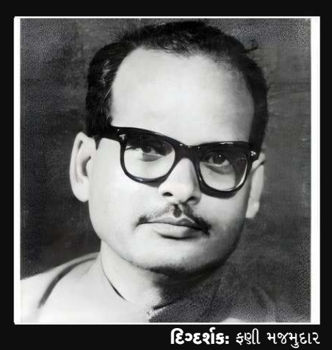
દિગ્દર્શક: ફણી મજમુદાર

ગીત : મજરુહ સુલતાનપુરી, સ્વર : લતા મંગેશકર સંગીત : ચિત્ર ગુપ્ત ફિલ્મ: ઊંચે લોગ દિગ્દર્શક: ફણી મજમુદાર વર્ષ : 1965 કલાકાર: અશોકકુમાર, રાજકુમાર, ફિરોઝ ખાન, કનૈયાલાલ, કુમુદ ત્રિપાઠી, દેવેન વર્મા, તરુણ બોઝ, કે. આર. વિજયા, નંદા