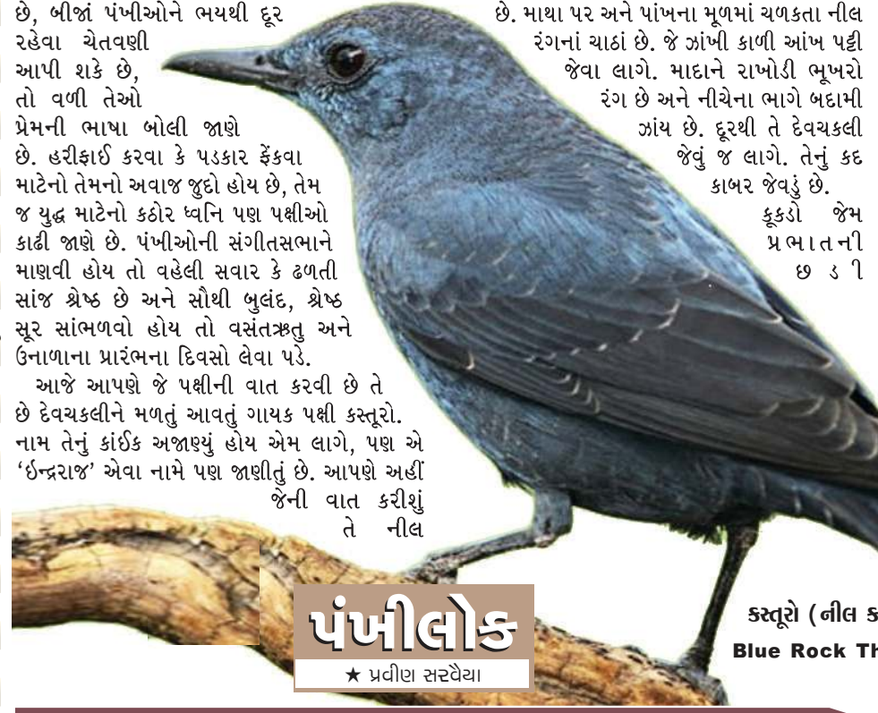
કસ્તૂરો (નીલ કસ્તૂરો- Blue Rock Thrush)

કુકડો જેમ પ્રભાતની છડી પોકારે છે, તેમ કસ્તૂરો અથવા ઈન્દ્રરાજ વહેલા પ્રભાતે ભુલંદ અને સિસોટી જેવા મધુર અવાજે ઉપાનું અભિવાદન કરે છે. જોકે એ માનવવસતિવાળા પ્રદેશમાં શિયાળે જ આવે છે. એમ છતાં તે ભાગભગીયામાં પણ ક્યારેક કાયમી રીતે રહી જાય છે. શિયાળાની ઋતુમાં તે લગભગ આખા રાજ્યમાં વ્યાપક રીતે દેખાય છે.તેનું રહેઠાણ મોટા ભાગે ગીચ વનસ્પતિ હોય તેવા ખડકાળ અને ઝરણાવાળા પ્રદેશોમાં છે, જ્યાં ધસમસતા પાણીમાંથી તે પાણીનાં જીવંત પકડીને આરોગી જાય છે. તેને મુલ્યા ઉજ્જડ, ખડકાળ ઢોળાવ ગમે છે. તે જૂના કિલ્લાઓ અને ઈમારતો તેમજ દરિયાકિનારાના ખડકો રહેવા માટે પસંદ કરે છે. જીવંત ઉપરાંત તે ઈયળો, કાચિંડા, કાનખજૂરા, નાનાં ફળો ખાય છે. તેને કરચલા પણ બહુ ભાવે છે. તે પાણી પડતું હોય તેવી કુદરતી જગ્યાએ વારંવાર કૂદે છે. ત્યાં ખડક પર બેસી પોતાની પૂંછડી વારંવાર પંખાની જેમ તે ઉઘારે છે અને આંચકા મારીને ઉપર-નીચે કરે છે. કસ્તૂરો માણસ સિસોટી મારે તેવા આશ્ચર્યજનક સૂર કાઢી જાણે છે. વળી તેના ગાનમાં કોઈ જ કારણ વિના ભારે આરોહ-અવરોહ આવે છે.કસ્તૂરાનો માળો ઘણે ભાગે પાણીના ધોધની પાસે હોય છે અથવા ભેખડ કે ઊભી કરાડની ઓથે હોય છે. માળો બનાવવા તે ઘાસ, સાકીકડાં અને શેવાળનો ઉપયોગ કરે છે. માળાને કાઢવ વડે મજબૂત બનાવવામાં આવે છે. માળો પહોંચાય નહીં એવી જગ્યાએ હોય છે. માઠા ચારથી પાંચ લી લા શ પ ડ ત ા