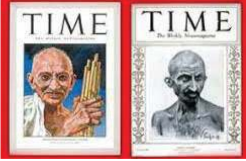
એટનબરોની ફિલ્મ જોયા પછી જ જાણતા થયા હશે!

ગાંધીજી વિશે મહાન વિજ્ઞાની આલ્બર્ટ આઈન્સ્ટાઈને 1939માં કહ્યું હતું કે - આવનારી પેઢીઓ ભાગ્યે જ માનશે કે હાડમાંસનો બનેલો ગાંધી જેવો માણસ આપણી વચ્ચે જન્મ્યો હતો. અમેરિકામાં અશ્વેતોના હક માટે ચળવળ ચલાવનારા માર્ટિન લ્યુથર કિંગ ગાંધીજીની વિચારધારાથી પ્રભાવિત હોવાનું અનેક વખત કહી ચૂક્યા હતા. અમેરિકન ઈતિહાસકાર સ્ટેનલી વોલપાર્ટે તો ગાંધીજીને બુદ્ધ પછીના સૌથી મહાન ભારતીય ગણ્યા હતા. ફિલ્મના દિગ્દર્શક એટનબરોએ જે પુસ્તકથી પ્રભાવિત થઈને ગાંધીજી વિશે 'ગાંધી' ફિલ્મ બનાવવાનું નક્કી કર્યું એ પુસ્તક વિદેશી પત્રકાર લૂઈ ફિશરે લખ્યું હતું. આ માટે તેઓ ગાંધીજી સાથે પૂરું એક અઠવાડિયું રહ્યા હતા! જો ગાંધીજીને કોઈ