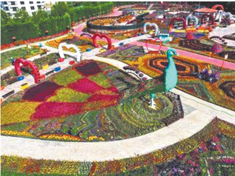
તુર્કીના કોન્યા શહેરમાં આવેલો આ મનમોહક સેલ્યુકલુ ફલાવર ગાર્ડનનો એસ્ટિયલ વ્યુ (આકાશી નજારો) છે. ૧૧,૫૦૦ ચોરસ મીટરના વિશાળ વિસ્તારમાં પથરાયેલા આ બગીચામાં ૨૮ જુદી જુદી પ્રખાતિની ૮૪ વેરાયટીના આશરે ૩.૮૫,૦૦૦ ફૂલો ખીલી ઉઠ્યા છે. કુદરત અને માનવસર્જિત કળાના આ અદ્ભૂત સંગમ સમાન રંગબેરંગી ગાર્ડનને જોવા માટે દર વર્ષે દેશ-વિદેશથી હજારો પ્રવાસીઓ અહીં મુલાકાત લે છે.