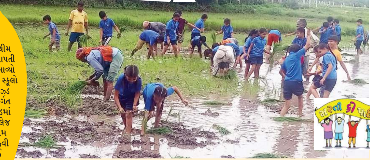
સ્કૂલ દ્વારા બાળકોને ખેતી કરતા અને રોટલી બનાવતા પણ શીખવાડાય છે