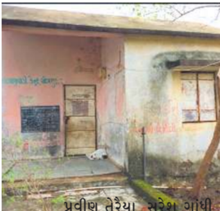
નવી ઈમારત બનાવવાની માંગ કરી રહ્યા છે.