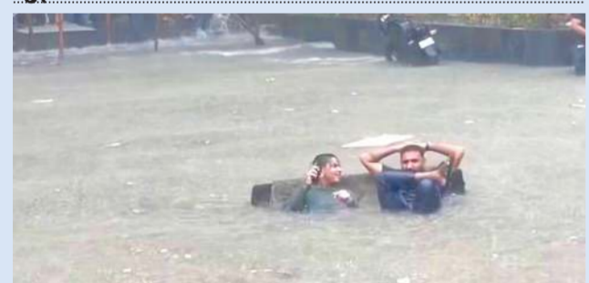
ભારે કરી! રસ્તાઓ પર નદીની જેમ ઘસમસતા પાણી વહી રહ્યા છે અને લોકો ચિંતામાં છે, ત્યારે બે સુરતી યુવાનોએ આ પૂરની સ્થિતિમાં પણ મોજ કરવાનો અનોખો જુગાડ શોધી કાઢ્યો હતો. રસ્તા પર વહી રહેલા ખેરદાર પાણીની વચ્ચે બેને જાણી મસ્ત આરામદાયક સોફા નાખીને બેઠા હતા. આજુબાજુથી પાણી વહી રહ્યું છે અને તેઓ જાણે કોઈ રિસોર્ટમાં બેઠા હોય તેમ જલસાથી સોફા પર બેસીને પૂરની મજા માણી રહ્યા હતા. આ અદભુત અને રમૂજી નજરો જોઈને લોકો હસી-હસીને લોટપોટ થઈ ગયા હતા. મુશ્કેલીના સમયે પણ ટેન્શન લીધા વગર રિલેક્ષિંગની મજા કેમ લેવી, તે કોઈ સુરતીઓ પાસેથી શોખે.