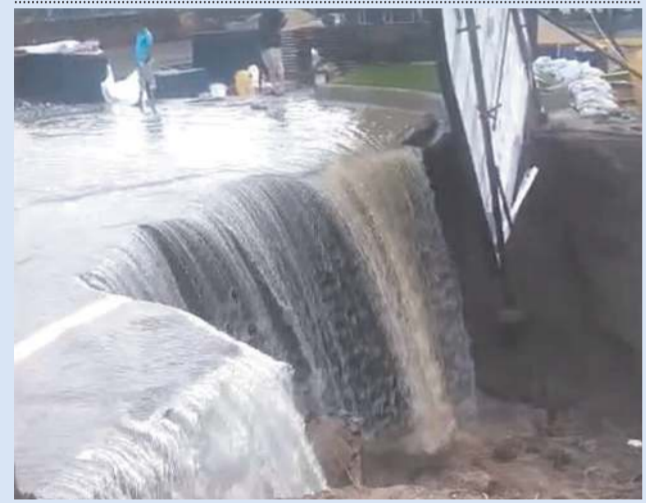
સુરતમાં વરસેલા અવિરત વરસાદના કારણે મોટા વરાછા વિસ્તારમાંથી એક ચિંતાજનક વીડીયો સામે આવ્યો છે. અહીં રિવર સાઈડ પર આવેલી 'મિરેકલ સાઈટ' પાસે ભારે વરસાદના કારણે અચાનક મોટા પ્રમાણમાં માટી ઘસી પડી હતી. માટી ઘસી જવાના કારણે ઉપરથી વહી રહેલું વરસાદી પાણી ખૂબ જ વેગ સાથે નીચે પડવા લાગ્યું હતું, જેથી ત્યાં જાણે કુદરતી ધોધ વહેતો થઈ ગયો હોય તેવો ઘાટ સર્જાયો હતો. આ દ્રશ્યો જોઈને આસપાસના લોકોમાં કુતૂહલ સાથે ભયનો માહોલ પણ જોવા મળ્યો હતો.