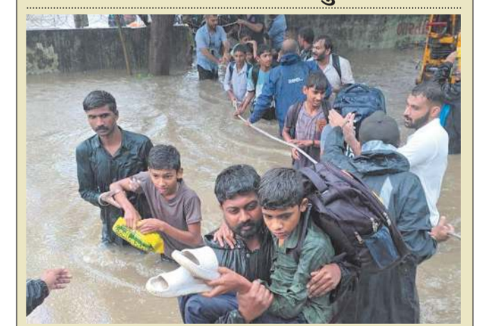
નાના વરાછા ખાતે આદર્શ નિવાસી શાળાના વિદ્યાર્થીઓની તાત્કાલિક અભ્ય સલામત સ્થળે ખસેડવામાં આવ્યા હતા. મનપા દ્વારા ત્યાં રહેવા-જરવા સહિતની તમામ વ્યવસ્થાઓ સુનિશ્ચિત કરવામાં આવી હતી.