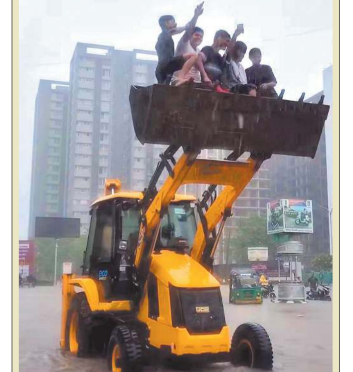
સુરતમાં જળબંધાકારની સ્થિતિ વચ્ચે સુરતીઓની અનોખી મોજ અને જુગાડના કિસ્સાઓ જોવા મળ્યા હતા. કેટલાક લોકોએ રસ્તા પર ભરાયેલા વરસાદી પાણીથી બચવા અને મજા લેવા માટે સીધું જેસીબી મશીન પર સવારી કરી હોવાના દ્રશ્યો સામે આવ્યા હતા.