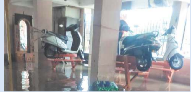
ભારે વરસાદને કારણે નીચાણવાળા વિસ્તારો અને સોસાયટીઓના પાર્કિંગમાં ગોઠાણમાં પાણી ભરાઈ જતાં વાહનોને ડૂબતા બચાવવા માટે લોકોએ મનપાના બાંકડા ઉપર પોતાના ટુ-વ્હીલર રાઈડરોને પાર્ક કરી દીધા હતા.