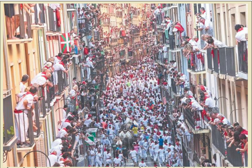
સ્પેનના પેમ્બલોના પ્રખ્યાત 'બુલ રન' ઉત્સવનો પ્રારંભ: સ્પેનના પેમ્બલોના શહેરમાં પરંપરાગત સેન ફર્મિન ફેસ્ટિવલ અંતર્ગત યોજાતી 'એન્સિએરો' (બુલ રન - આખલા દોડ)માં ઉત્સાહભરે ભાગ લઈ રહેલા લોકો. શહેરના સ્ક્રાફ સંતની યાદમાં દર વર્ષે ૬ થી ૧૪ જુલાઈ દરમિયાન આ ઉત્સવ યોજાય છે. જૂના શહેરની સાંકડી ગલીઓમાં દોડતા આખલાઓથી આગળ નીકળી જવાની રોમાંચક સ્પર્ધામાં ભાગ લેવા માટે દુનિયાભરમાંથી પ્રવાસીઓ અહીં ઉમટી પડે છે.