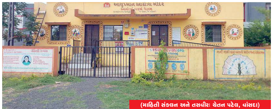
(માહિતી સંકલન અને તસવીર: ચેતન પટેલ, વાંસદા)

ધરમપુરીમાં આરોગ્યની પ્રાથમિક સુવિધા માટે સબ સેન્ટર કાર્યરત છે, જ્યાં ગામના બીમાર લોકોને પ્રાથમિક આરોગ્ય તપાસ તેમજ જરૂરી સારવાર આપવામાં આવે છે. આ સબ સેન્ટરના કારણે ગ્રામજનોને નાની-મોટી બીમારીઓમાં ઘરમાં જ સારવાર મળી રહે છે. આશરે 2800 જેટલી વસતી ધરાવતા ધરમપુરીના દર્દીઓને વધુ સારવારની જરૂરિયાત ઊભી થાય ત્યારે માત્ર 6 કિલોમીટરનું અંતર કાપીને વાંસદા સ્થિત સરકારી હોસ્પિટલ સુધી સરળતાથી પહોંચી શકાય છે. ગામથી વાંસદા સુધી પાકા ડામર માર્ગની સુવિધા હોવાથી 108 એમ્બ્યુલન્સ સહિત અન્ય વાહનો પણ ઝડપથી દર્દીઓને હોસ્પિટલ સુધી પહોંચાડી શકે છે. આ રીતે ધરમપુરી ગામમાં પ્રાથમિક આરોગ્ય સેવાઓ સાથે નજીકમાં ઉપલબ્ધ હોસ્પિટલ અને સારા માર્ગ વ્યવહારને કારણે ગ્રામજનોને આરોગ્ય ક્ષેત્રે જરૂરી સુવિધાઓનો લાભ મળી રહ્યો છે.