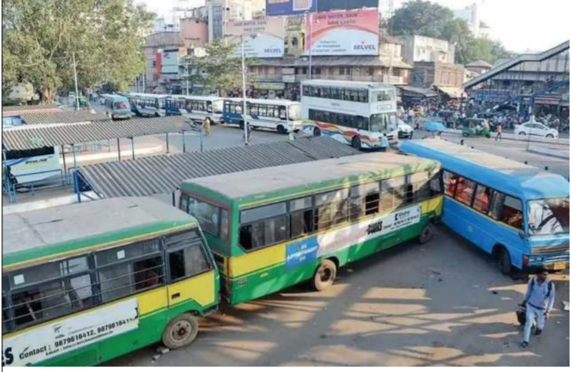
વડોદરા મહાનગરપાલિકા દ્વારા વિનાયક લોજિસ્ટિક્સને ત્રણ મહિનાનું એક્સટેન્શન આપવામાં આવતા સવારે બંધ કરાયેલી 160 બસો ફરી શહેરના વિવિધ રૂટ પર દોડતી થઈ છે

(પ્રતિનિધિ) વડોદરા, તા. 1 વડોદરા શહેરમાં આજે સવારે અચાનક બંધ થયેલી સિટી બસ સેવા થોડા જ કલાકોમાં ફરી શરૂ થતાં હજારો મુસાફરોને મોટી રાહત મળી છે. વડોદરા મહાનગરપાલિકા દ્વારા વિનાયક લોજિસ્ટિક્સને ત્રણ મહિનાનું એક્સટેન્શન આપવામાં આવતા સવારે બંધ કરાયેલી 160 બસો ફરી શહેરના વિવિધ રૂટ પર દોડતી થઈ છે.