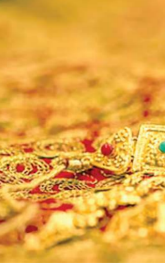
ભારતીય ઉત્પાદનોની સ્પર્ધાત્મકતા પર પણ અસર થઈ રહી છે.

વડાપ્રધાનના દેશહિતમાં સોનાની આયાત નિયંત્રિત રાખવાના આહ્વાનને ઉદ્યોગે સંપૂર્ણ સમર્થન આપ્યું છે. પરંતુ સાથે સાથે નિકાસ માટે જરૂરી સોનાની પૂરતી ઉપલબ્ધતા જળવાઈ રહે તે પણ એટલું જ જરૂરી છે, કારણ કે જેમ્સ એન્ડ જ્વેલરી ઉદ્યોગ દેશ માટે મહત્વપૂર્ણ વિદેશી ચલણ કમાવતો ક્ષેત્ર છે. સોનાના ભાવમાં 45 ટકાથી વધુનો ઉછાળો નોંધાયો છે. ઉદ્યોગ સામેનું બીજું મોટું પડકાર સોનાના ભાવમાં થયેલો અસાધારણ વધારો છે. એપ્રિલ-મે 2026 દરમિયાન સોનાની સરેરાશ કિંમત 4,723.88 ડોલર પ્રતિ ટ્રોય ઓંસ સુધી પહોંચી હતી, જ્યારે ગયા વર્ષે આ જ ગાળામાં તે 3,242.48 ડોલર પ્રતિ ટ્રોય ઓંસ હતી. એટલે કે એક