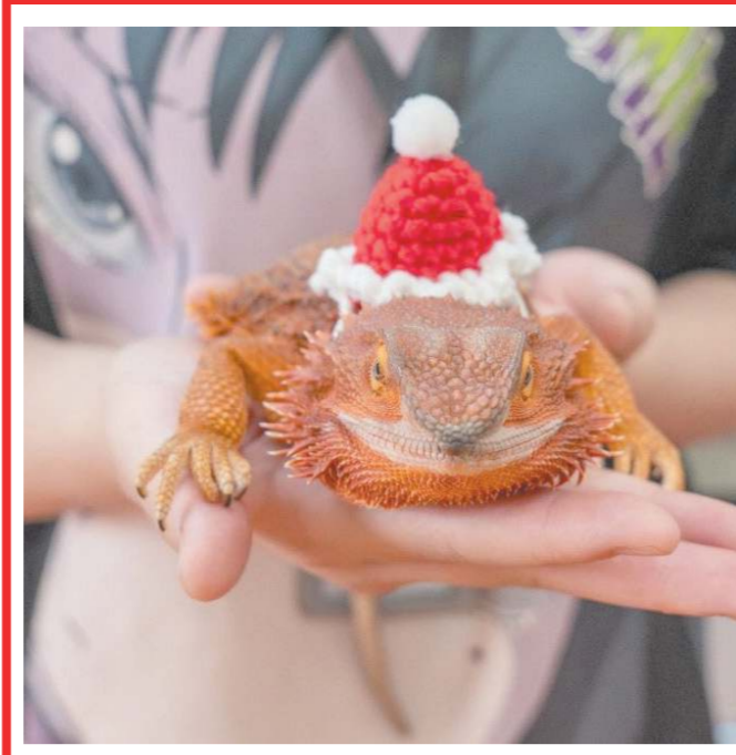
ચીનની રાજધાની બીજિંગના પિંગગુ ડિસ્ટ્રિક્ટમાં ૧૯ જૂન, ૨૦૨૬ના રોજ 'બીજિંગ વર્લ્ડ રેપ્ટાઇલ્સ એક્સ્પો ૨૦૨૬'નો ભવ્ય પ્રારંભ થયો છે. આ પ્રદર્શનમાં મોટી સંખ્યામાં લોકો મુલાકાત લઈ રહ્યા છે, જેમાં એક બાળક પણ સરીસૃપોને જોવા પહોંચ્યું હતું. આ ઇવેન્ટ દરમિયાન એક પ્રદર્શનકર્તાએ મુલાકાતીઓ માટે ખાસ 'બિયર્ડ્સ ડેંગ' નામની ગરોળી પ્રદર્શિત કરી હતી. એક્સ્પોમાં આવેલા લોકો આ અદભુત અને દુર્લભ જીવોને જોઈને રોમાંચિત થઈ રહ્યા છે અને એક મહિલા આ સરીસૃપોના ખાસ ફોટા પોતાના કેમેરામાં કેદ કરતી જોવા મળી હતી.

જે ગંભીર અને હળવી બંને શણગારમાં પ્રભાવશાળી રહ્યો છે. કૃતિ સેનને તેના કરિયરનું સર્વશ્રેષ્ઠ પ્રદર્શન આપ્યું છે અને તે ફિલ્મની સરકારમાં તરીકે ઉભરી આવી છે. રાહિમ કાંધાના પછા પોતાનો શ્રેષ્ઠ પ્રયાસ કર્યો છે, પરંતુ તેના પાત્રને વધુ ક્લોપ મળ્યો નથી અને તેણે તેના હિન્દી ઉચ્ચાર પર હજી થોડું કામ કરવાની જરૂર છે. ટૂંકમાં, આ મૂવી સિનેમા હોલમાં જોવા જેવી મનોરંજક ફિલ્મ છે.