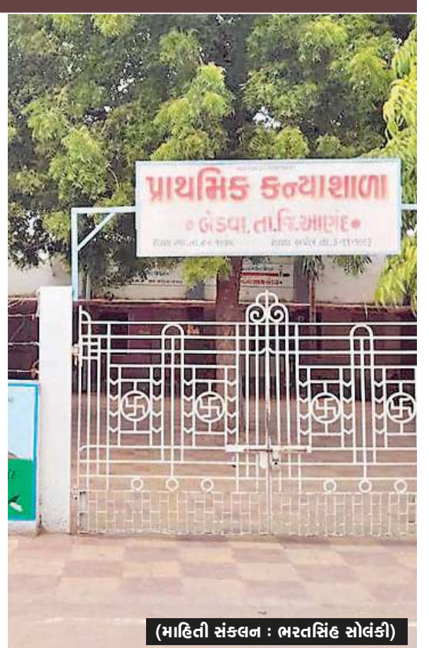
(માહિતી સંકલન : ભરતસિંહ સોલંકી)

શૈક્ષણિક જગત માટે પ્રેરણારૂપ અને ગર્વ લઈ શકાય અને આદર્શ શાળા કહી શકાય એવી સરકારી કન્યા પ્રાથમિક શાળા બેડવા ગામમાં છે. આણંદ જિલ્લાના આણંદ તાલુકાના બેડવા ગામ તાબાની સરકારી ગુજરાતી પ્રાથમિક શાળા છે. પ્રાથમિક શાળાની શિક્ષણ પદ્ધતિ, બાળકો પ્રત્યેનો અભિગમ, વિવિધ સુવિધાઓ અને સ્વચ્છતા સહિતના અનેકવિધ મુદ્દાઓ ખુબ જ અનુકરણીય ઉદાહરણ રૂપ બનેલ છે સરકારી પ્રાથમિક શાળા બેડવા ગામના પાદરમાં આવેલ છે. આ શાળામાં આશરે ૨૭૫થી પણ વધારે બાળકો અભ્યાસ કરે છે. આ શાળામાં પ્રવેશતાં જ મન પ્રસન્ન થઈ જાય છે, પ્રાથમિક શાળામાં ભોજન સમયે જમવા માટે પ્રાકૃતિક ખેતી પદ્ધતિથી વાવેતર કરાયેલા શાકભાજી, ફળ ફળાઈ બાળકોના સાત્વિક ભોજન માટે વાપરવામાં આવે છે. વિદ્યાર્થીઓ ટુકડીઓ બનાવીને નીચે બેસીને જમે છે. જેનાથી તેમનામાં સમૃદ્ધ ભાવનાના જેવા ગુણોનું સિંચન થાય છે, શાળાના શિક્ષણકાર્ય પણ ખૂબ જ સુંદર છે. બાળકોને અભ્યાસક્રમ સરળતાથી સમજાવી શકે તેવા વિષય નિષ્ણાત શિક્ષકો છે. શાળામાં બાળકો સ્પોર્ટ્સ રીતે આ નિયમોનું ચુસ્ત પાલન કરે છે. કોઈપણ પ્રકારના પ્લાસ્ટિકમાં પેક કરેલ ખોરાક શાળા સંકુલની અંદર લાવતા નથી. જેથી શાળા પરીસરમાં ક્યાંય પણ પ્લાસ્ટિક જેવા મળતું નથી. સ્વચ્છતા બાબતે પણ આ શાળા અવ્વલ નંબરે છે. મોટી સંખ્યામાં બાળકો હોવા છતાં બાળકો પોતે સ્વચં સ્વચ્છતા બાળવે છે. શાળાના પત્રિકા સરમાં વિવિધ પ્રકારના આયુર્વેદિક કુલ છોડ, વનસ્પતિનો પણ ઉછેર કરાયો છે. જેથી સમગ્ર શાળા હરિયાળી છવાયેલી જેવા મળે છે.