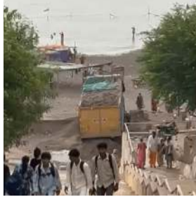
સ્નાન માટે ઉપયોગમાં લેવાતા ઘાટ પરથી ભારે વાહન ઉતરતાં સ્થાનિકોમાં આશ્ચર્ય અને ચિંતા બંને જોવા મળી હતી.

(પ્રતિનિધિ) કરજણ, તા.11 કરજણ તાલુકાના પ્રસિદ્ધ તીર્થસ્થળ નારેશ્વર ખાતે બનેલી એક વિચિત્ર ઘટનાનો વીડિયો સોશિયલ મીડિયામાં ઝડપથી વાયરલ થઈ રહ્યો છે. વીડિયોમાં નારેશ્વર મંદિરના મુખ્ય ઘાટના પગથિયાં પરથી એક ડમ્પર નીચે ઉતરી સીધું નદી કિનારા સુધી પહોંચતું જોવા મળતા સમગ્ર પંથકમાં ચર્ચાનો વિષય બન્યો છે.