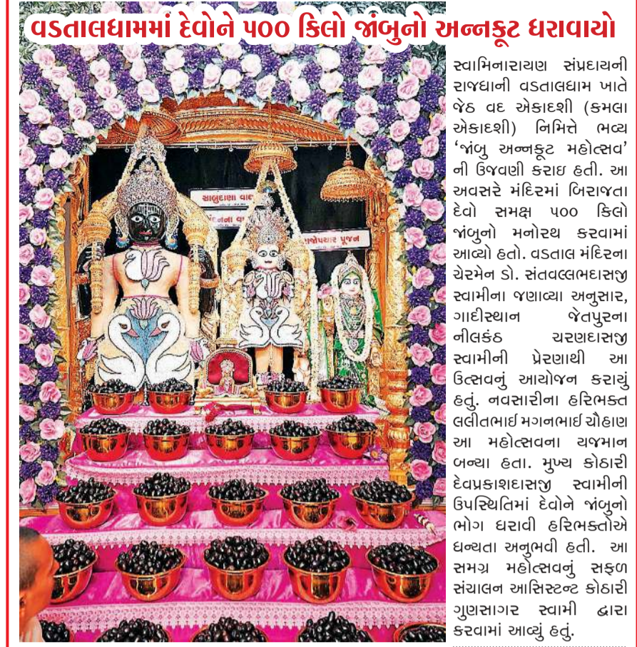
વડતાલધામમાં દેવોને ૫૦૦ કિલો જાંબુનો અન્નકૂટ ધરાવાયો

ખનન પ્રવૃત્તિને અંજામ આપવા માટે ભૂમાફિયાઓ દ્વારા આખું સુનિયંત્રિત નેટવર્ક ગોઠવવામાં આવ્યું હતું. ચોમાસા પહેલા ડબલ ગતિથી ખનન કરવા માટે તેઓ નજીકના ગામથી લઈને ખનન સ્થળ સુધી પોતાના માણસો ગોઠવતા હતા. આ માણસો કોઈ પણ શંકાસ્પદ કે સરકારી ગાડીની હલચલની માહિતી તુરંત જ વોટ્સએપ વોર્કસ મેસેજ દ્વારા ચોક્કસ ગ્રુપમાં આપતા હતા, જેથી અધિકારીઓ પહોંચે તે પહેલા જ તેઓ ભાગી છૂટતા હતા. ખોડે, આ વખતે તેમની આ ચાલાકી કામ ન આવી અને તંત્રને મોટી સફળતા મળી છે.