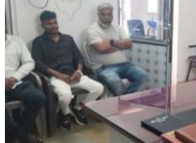
જીવ જોખમમાં મુકાઈ શકે છે. પોલીસ દ્વારા ખાસ ભારપૂર્વક જણાવવામાં આવ્યું કે માર્ગ અકસ્માતોને અટકાવવા અને માનવજીવનની સુરક્ષા સુનિશ્ચિત કરવા માટે તમામ વાહનચાલકોએ જવાબદારીપૂર્વક વાહન ચલાવવું જરૂરી છે. અકસ્માતોના બનાવોમાં ઘટાડો થાય અને કોઈપણ વ્યક્તિનું મૃત્યુ ન થાય તે હેતુથી આ બેઠકનું આયોજન કરવામાં આવ્યું હતું.