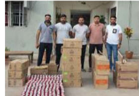
વાહનને રોકવાનો પ્રયાસ કર્યો હતો. પોલીસને જોઈ કાર ચાલક વાહન સ્થળ પર મૂકીને ફરાર થઈ ગયો હતો. ત્યારબાદ પંચોની હાજરીમાં વાહનની તપાસ કરતા અંદરથી વિવિધ શ્રાન્ડના ભારતીય બનાવટના વિદેશી દારૂના ક્વાર્ટર તથા બિયરના ટીન મળી કુલ 1,225 નંબર દારૂની બોટલો અને ટીન મળી આવ્યા હતા. ઝડપાયેલા દારૂની કિંમત રૂ. 4,35,213 હોવાનું જણાવા મળ્યું છે. ઉપરાંત કારની કિંમત રૂ. 3,00,000 ગણતા કુલ રૂ. 7,35,213નો મુદામાલ કબજે કરવામાં આવ્યો છે.

(પ્રતિનિધિ) છોટાઉદેપુર, તા.10 જિલ્લામાં દારૂબંધીના કડક અમલ અંતર્ગત રંગપુર પોલીસે મહત્વપૂર્ણ કાર્યવાહી હાથ ધરી અત્રોલી ગામ નજીકથી ભારતીય બનાવટના વિદેશી દારૂનો મોટો જથ્થો ઝડપી પાડ્યો હતો. પોલીસે દારૂ સાથે એક સ્વિફ્ટ કાર મળી કુલ રૂ. 7,35,213નો મુદામાલ કબજે કરી કાયદેસરની કાર્યવાહી હાથ ધરી છે. મળતી માહિતી મુજબ રંગપુર પોલીસ સ્ટેશનના સ્ટાફ દ્વારા વિસ્તારમાં પેટ્રોલિંગ દરમિયાન પાનગી બાતમી મળી હતી કે અત્રોલી ગામ તરફથી સ્વિફ્ટ કાર (નંબર GJ-06-KH-4453) માં વિદેશી દારૂનો જથ્થો છાંં જવામાં આવી રહ્યો છે. બાતમીના આધારે પોલીસે નાકાબંધી ગોઠવી