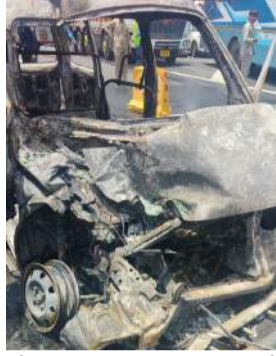
પોલીસ તાત્કાલિક ઘટનાસ્થળે પહોંચી હતી અને સમગ્ર ઘટનાની તપાસ શરૂ કરી હતી. પોલીસે મૃતદેહને પોસ્ટમોર્ટમ અર્થે ખસેડવાની તેમજ ઘાયલોના નિવેદન મેળવવાની કાર્યવાહી હાથ ધરી હતી.

(પ્રતિનિધિ) સાવલી, તા.10 સાવલી તાલુકાના પોઈચા નજીક અમદાવાદ-વડોદરા હાઈવે પર મંગળવારે સાંજના સમયે ગંભીર માર્ગ અકસ્માત સર્જતા સમગ્ર વિસ્તારમાં અરેરાટી વ્યાપી ગઈ હતી. પ્રાપ્ત વિગતો અનુસાર ઈકો કાર આગળ ચાલતી પીકઅપ વાન ની પાછળ ધડાકા ભેર ધૂસી જતાં અકસ્માત સર્જાયો હતો. અકસ્માત એટલો ભયંકર હતો કે ટક્કર વાગ્યા પછી ઈકો માં આગ ભભૂકી ઊઠી હતી. આગ ઝડપથી ફેલાતા ઈકો કારના ચાલકને બહાર નીકળવાનો મોકો ન મળતાં ઘટનાસ્થળે જ જીવતો ભુજાઈ ગયો હતો.