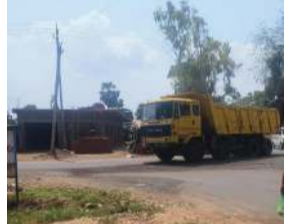
કારણે સમગ્ર વિસ્તારમાં અનેક સવાલો અને શંકાઓ ઊભી થઈ રહી છે. સ્થાનિક લોકોમાં ઊંઠી રહેલી લોકભૂમિ અનુસાર છેલ્લા ઘણા સમયથી કદવાલ મામલતદાર કચેરી દ્વારા ઓવરલોડ તેમજ ગેરકાયદેસર ખનિજ વહન કરતા વાહનો સામે કોઈ નોંધપાત્ર કાર્યવાહી કરવામાં આવી નથી. જેના કારણે લોકોમાં એવી ચર્ચાઓ જોર પકડી રહી છે કે આખરે આવા વાહનોને કોનું રક્ષણ મળી રહ્યું છે?

(પ્રતિનિધિ) છોટાઉદેપુર, તા.10 જિલ્લાના કદવાલ પંથકમાં ગેરકાયદેસર અને ઓવરલોડ રેતી વાહનનો કાળો કારોબાર દિવસે દિવસે બેફામ બનતો જઈ રહ્યો છે. સૌથી ચોંકાવનારી બાબત એ છે કે ઓવરલોડ રેતી, પથ્થર, માટી અને લીલા લાકડાં ભરેલા વાહનો કદવાલ મામલતદાર કચેરીની નજીકથી અને કચેરીની સામેના માર્ગ પરથી જ ખુલ્લેઆમ પસાર થાય છે, છતાં જવાબદાર તંત્ર દ્વારા આવા વાહનો સામે કોઈ અસરકારક દંડાત્મક કાર્યવાહી કરવામાં આવતી નથી. જેના