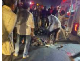
અકસ્માતની જાણ થતાં સ્થાનિક લોકો મોટી સંખ્યામાં ઘટનાસ્થળે દોડી આવ્યા હતા. પોલીસે ઘટનાસ્થળે પહોંચી વડુ તપાસ હાથ ધરી હતી. આ અકસ્માતની ઘટના વચ્ચે નોંધનીય બાબત એ છે કે જિલ્લામાં ઓમ્પર સાથે જોડાયેલો આ સળંગ બીજા દિવસે જીવલેણ અકસ્માત છે.

(પ્રતિનિધિ) બોડેલી, તા.10 છોટાઉદેપુર જિલ્લાના બોડેલી નજીક આવેલા ચારોલા ગામ પાસે મંગળવારે વડુ એક ગમખવાર માર્ગ અકસ્માત સર્જાયો હતો. ઓમ્પર અને બાઈક વચ્ચે થયેલી ટક્કરમાં બાઈક ચાલક યુવાનનું ઘટનાસ્થળે જ કરુણ મોત નીપજતાં વિસ્તારમાં શોકની લાગણી ફેલાઈ ગઈ હતી. પ્રાપ્ત વિગતો મુજબ, બાઈક પર પસાર થઈ રહેલા યુવાને ઓમ્પર ચાલકે અડકે લેતા ગંભીર અકસ્માત સર્જાયો હતો. ટક્કર એટલી ભયાનક હતી કે યુવાને ગંભીર ઈજાઓ પહોંચ્યાં તેનું સ્થળ પર જ મોત નીપજ્યું હતું.