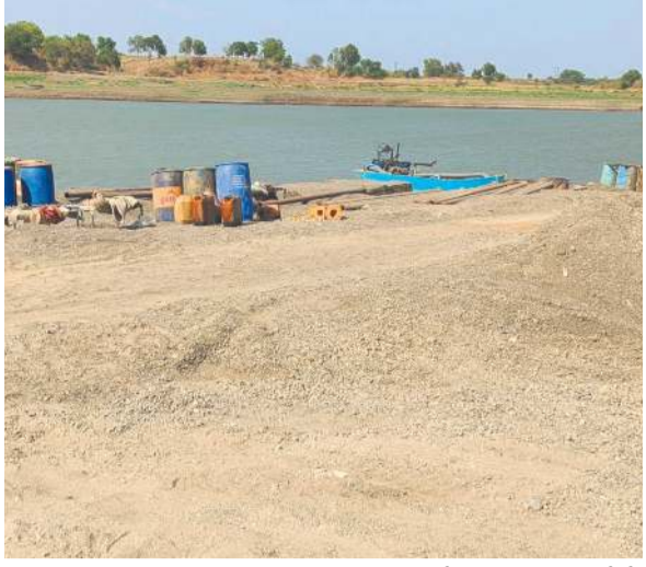
નિઝરના માલવદાર કુકરમુંડા ઘટના સ્થળે આકસ્મિક દરોડો તથા તેમની સંયુક્ત ટીમ દ્વારા પાડવામાં આવ્યો હતો. તપાસ

રેતી, ૬ હિતાચી મશીન, ૧ પિકઅપ ટેમ્પો, ૧૦ નાવડી સહિત રૂ.૧.૫૮ કરોડનો મુદ્દામાલ સીઝ