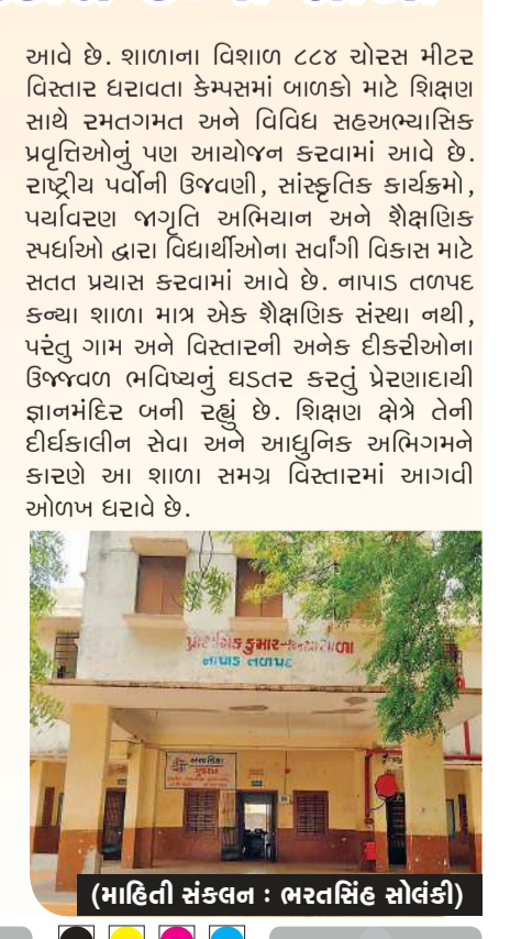
(માહિતી સંકલન : ભરતસિંહ સોલંકી)

શાળાના વિશાળ ૮૮૪ ચોરસ મીટર વિસ્તાર ધરાવતા કેમ્પસમાં બાળકો માટે શિક્ષણ સાથે રમતગમત અને વિવિધ સહઅભ્યાસિક પ્રવૃત્તિઓનું પણ આયોજન કરવામાં આવે છે. રાષ્ટ્રીય પવોની ઉજવણી, સાંસ્કૃતિક કાર્યક્રમો, પર્યાવરણ જાગૃતિ અભિયાન અને શૈક્ષણિક સ્પર્ધાઓ દ્વારા વિદ્યાર્થીઓના સર્વાંગી વિકાસ માટે સતત પ્રયાસ કરવામાં આવે છે. નાપાડ તળપદ કન્યા શાળા માત્ર એક શૈક્ષણિક સંસ્થા નથી, પરંતુ ગામ અને વિસ્તારની અનેક ઈકરીઓના ઉજવણ ભવિષ્યનું ઘડતર કરતું પ્રેરણાદાયી જ્ઞાનમંદિર બની રહ્યું છે. શિક્ષણ ક્ષેત્રે તેની દીર્ઘકાલીન સેવા અને આધુનિક અભિગમને કારણે આ શાળા સમગ્ર વિસ્તારમાં આગવી ઓળખ ધરાવે છે.