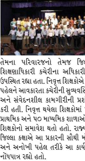
તેમના પરિવારજનો તેમજ જિલ્લા શિક્ષણાધિકારી કચેરીના અધિકારીઓ ઉપસ્થિત રહ્યા હતા. નિવૃત્ત શિક્ષકોએ આ પહેલને આવકારતા કચેરીની સુવ્યવસ્થિત અને સંવેદનશીલ કામગીરીની પ્રશંસા કરી હતી. નિવૃત્ત થયેલા શિક્ષકોમાં ૫૫ પ્રાથમિક અને ૫૦ માધ્યમિક શાળાઓના શિક્ષકોનો સમાવેશ થતો હતો. રાજ્યમાં જિલ્લા કક્ષાએ આ પ્રકારની સૌથી મોટી અને અનોખી પહેલ તરીકે આ કાર્યક્રમ નોંધપાત્ર રહ્યો હતો.

(પ્રતિનિધિ) વડોદરા, તા.2 વડોદરા જિલ્લા શિક્ષણ સમિતિ અને જિલ્લા શિક્ષણાધિકારી કચેરી દ્વારા ૩૦થી ૩૧ વર્ષ સુધી શિક્ષક શ્રેણી નિષ્કાપૂર્વક થાય તેવી સુવિધા ધોરણે મળે છે તેની પગલે ૧૦૫ શિક્ષકોને પેન્શન મળવાનું શરૂ થઈ જશે. તેમણે પાતરીપૂર્વક જણાવ્યું હતું કે પેન્શનના નિયમ સંબંધિત કામગીરી માટે કચેરીના ધક્કા ખાવા નહીં પડે અને દર મહિને પગારની જેમ જ સમયસર પેન્શન જમા થશે. આ કાર્યક્રમમાં નિવૃત્ત થતાં શિક્ષકો,