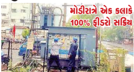
મોડીરાત્રે એક કલાકે 100% ફીડરો સક્રિય