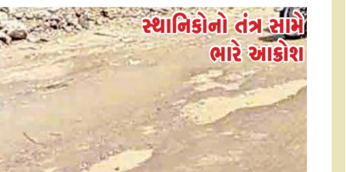
સ્થાનિકોનો તંત્ર સામે ભારે આકોશ

(પ્રતિનિધિ) વડોદરા, તા.2 નજીવા કમોસમી વરસાદે વડોદરા કોર્પોરેશનની પ્રી-મોન્ટ્રુન કામગીરીના ઘાવાઓ ધોવાઈ ગયા હોય તેવા દ્રશ્યો સામે આવી રહ્યા છે. શહેરના ગોરવા વિસ્તારમાં આવેલા મધુનગર અને તેની આસપાસના વિસ્તારોમાં પડેલા વરસાદના કારણે જ રસ્તાઓની હાલત અત્યંત બિસ્માર થઈ ગઈ છે. ઠેર-ઠેર રસ્તાઓ પર મોટા-મોટા ખાડાઓ પડી જતાં સ્થાનિક રહિશો અને ત્યાંથી પસાર થતા વાહનચાલકોને ભારે હાલાકીનો સામનો કરવો પડી રહ્યો છે. આ મુખ્ય માર્ગો પરથી પસાર થવું હવે સામાન્ય નાગરિકો માટે જોખમી સાબિત થઈ રહ્યું છે. વરસાદના કારણે રસ્તા પર પડેલા ખાડાઓમાં પાણી ભરાઈ જવાને લીધે વાહનચાલકો માટે ખાડાઓનો અંદાજ લગાવવો મુશ્કેલ બની ગયો છે. ખાસ કરીને દિવ્યકી વાહનચાલકો માટે અહીંથી પસાર થતું એ અકસ્માતને આમંત્રણ આપવા સમાન બની ગયું છે. પાણીથી ભરાયેલા ખાડાઓમાં વાહનો સ્લિપ થવાની અને ચાલકો પટકાવાની ઘટનાઓ સતત વધી રહી છે, જેના કારણે નિર્દોષ નાગરિકોને નાની-મોટી ઈજાઓ