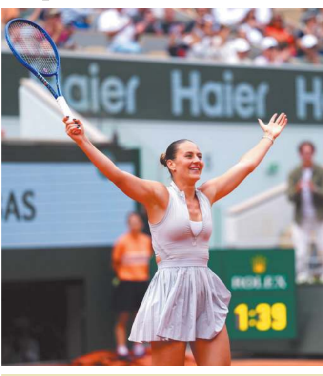
17 વર્ષ બાદ ક્વાર્ટર ફાઇનલમાં

માર્ટ કોસ્ટ્યુકે ચાર વખતની ચેમ્પિયન ઇગા સ્વિટેકને જતારે એનાસ્તાસિયા પોટાપોવાએ ડિકેન્ડેન્ગ ચેમ્પિયન ગફને હરાવી