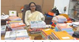
બુકેની જગ્યાએ શૈક્ષણિક સામગ્રી અને સાડીઓ સાથે પહોંચ્યા હતા. મળેલી પુસ્તકો અને પેન ફૂટપાથ, સ્લમ વિસ્તારો અને આર્થિક રીતે નબળા પરિવારોના બાળકોને શિક્ષણ માટે વિતરણ કરવામાં આવશે, જ્યારે સાડીઓ વૃદ્ધાશ્રમમાં રહેલી નિરાધાર માતાઓને અર્પણ કરાશે. મેયર માયા માવાણીએ જણાવ્યું હતું કે, ફૂલોના બુકે થોડા કલાકોમાં કરમાઈ જાય છે, જ્યારે પુસ્તક કોઈ બાળકના જીવનમાં કાયમી સ્મિત લાવી શકે છે. રસ્તા પર માતાની આંખો પકડીને હસતા જતા એક બાળકને જોઈ તેમને આ વિચાર આવ્યો હતો.

સુરત : મહાનગરપાલિકાના મેયર માયા માવાણીએ પદ સંભાળતાની સાથે જ ફૂલોના બુકે સ્વીકારવાની પરંપરા બંધ કરીને તેના સ્થાને પુસ્તકો, નોટબુક, પેન અને સાડીઓ ભેટરૂપે આપવા અપીલ કરી છે. મેયરની આ પહેલને શહેરના નાગરિકો અને સામાજિક સંસ્થાઓએ ઉત્સાહભેર વધાવી લીધી છે. સુરતવાસીઓએ આ અપીલને વધાવી લેતા પહેલા જ દિવસે મેયરના ટેબલ પર નોટબુક અને પુસ્તકોનો ઢગલો થઈ ગયો હતો. મેયર કાર્યાલયે આજે અનેક શુભેચ્છકો