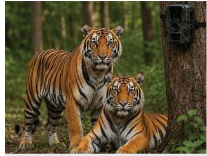
સાગટાળા અને કજેટા રેન્જમાં વાઘની સતત દેખરેખ, ૧૪ નાઈટ વિઝન કેમેરાથી મોનિટરિંગ

(પ્રતિનિધિ) દાહોદ તા.૨૯ ગુજરાતના વન્યજીવ પ્રેમીઓ માટે ખુશીના સમાચાર સામે આવ્યા છે. દાહોદના જંગલોમાં મધ્યપ્રદેશથી આવેલા વાઘ વસવાટ શરૂ કર્યો છે ત્યારે આ વિસ્તારમાં વાઘનો કાયમી વસવાટ અને તેના વંશવેલાનું સંવર્ધન થાય તે હેતુથી રાજ્ય સરકાર અને નેશનલ ટાઈગર કન્ઝર્વેશન ઓથોરિટી (NTCA) દ્વારા વિશેષ પ્રોજેક્ટ હાથ ધરવામાં આવ્યો છે. આ પ્રોજેક્ટ અંતર્ગત મધ્યપ્રદેશમાંથી બે વાઘણોને દાહોદના જંગલ વિસ્તારમાં લાવવામાં આવશે. આ મહત્વાકાંક્ષી પ્રોજેક્ટ માટે વન વિભાગ દ્વારા વિગતવાર એક્શન પ્લાન તૈયાર કરવામાં આવ્યો છે. એપ્રિલ મહિનાના અંતમાં NTCA અને