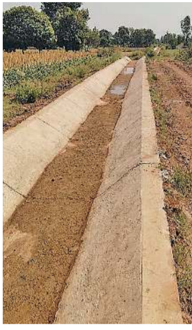
ત્યારે જો આ કેનાલ તૈયાર નહીં થાય તો ખેડૂતોને સિંચાઈના

ચોમાસું માથે છતાં ગેટ, કોઠા અને નળ નાખવાની કામગીરી બાકી