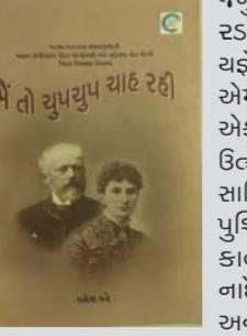
પુસ્તક: 'મैं तो सुपयुष राह रही, લેખક: યજ્ઞેશ દવે પ્રકાશક: ઝેન ઓપસ, અમદાવાદ, મૂલ્ય: રૂ. 350/-

ખૂબ દુ:ખી થાય, ઈર્ષા પામે તે તો ખરું જ પણ નાદેજ્દાની ઈર્ષા પામતા પીટરનું લગ્નજીવન પણ વળી પત્નીથી સુખી ન હતું. વાત એમ હતી કે તે તો સખતીય હતો. ખેર, એ લગ્ન વધારી ગયા પણ પીટર એવો સંગીતકાર હતો જેનું સંગીત સાંભળી ટોલ્સ્ટોય જેવા લેખક રડવા માંડેલા. યજ્ઞેશ દવેએ એક નવલકથા લખતા હોય એમ આ 162 પૃષ્ઠની પ્રેમકથા લખી છે. એકબીજાની પાસે આવ્યા વિના પ્રેમની ઉત્કટતા જીવી શકાય છે. નાદેજ્દા સાહિત્યની પણ વાચક છે. પુષ્કિન જમા કવિને પણ આગવી સૂક્ષ્મ કાવ્યદૃષ્ટિથી વાંચે છે પણ પીટર અને નાદેજ્દા વચ્ચે થતો પત્રવ્યવહાર પ્રેમનાં એક પાસાંઓ નિરૂપે છે. બે તમને પ્રેમ વાંચતાં આવડતો હશે તો આ 'મैं तो सुपयुष राह रही' નામનું પુસ્તક ગમશે. અહીં જે લખાયું છે તે તો સાવ અછરું છે અને તે તમારા વાચનથી જ પૂર્ણ થઈ શકે પણ એકબીજાને મળ્યા વિના આટલાં વર્ષ ચાહવું તેને શું કહેશો?'