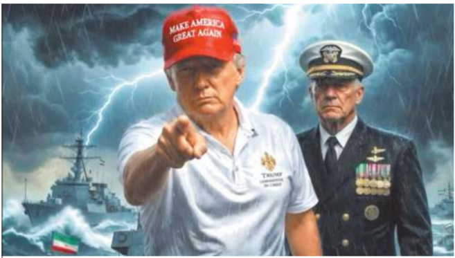
ઈરાન સમક્ષ અમેરિકાએ યુરેનિયમ ટ્રાન્સફર, પરમાણુ મર્યાદા સહિત પાંચ શરતો મૂકી

વોશિંગ્ટન, તા. ૧૭ : અમેરિકાના રાષ્ટ્રપતિ ડોનાલ્ડ ટ્રમ્પે રવિવારે પોતાના સોશિયલ મીડિયા પર કરેલી બે અલગ અલગ પોસ્ટથી ઈરાન સાથે ફરી એકવાર યુદ્ધ ભડકવાની આશંકાઓ વહેતી થઈ છે એ તેમની આ બંને પોસ્ટને ઈરાન માટે ગર્ભિત ચેતવણી તરીકે જોવામાં આવી રહી છે. ટ્રમ્પે સોશિયલ મીડિયા પ્લેટફોર્મ ટ્રુથ સાથે પોતાની એક તસવીર પોસ્ટ કરી, જેમાં તેઓ એક લશ્કરી કમાન્ડર સાથે સમુદ્રમાં એક જહાજ પર સવાર દેખાઈ રહ્યા છે. ટ્રમ્પે આ તસવીરને કેપ્શન આપ્યું, ...અનુસંધાન પાના 2 પર