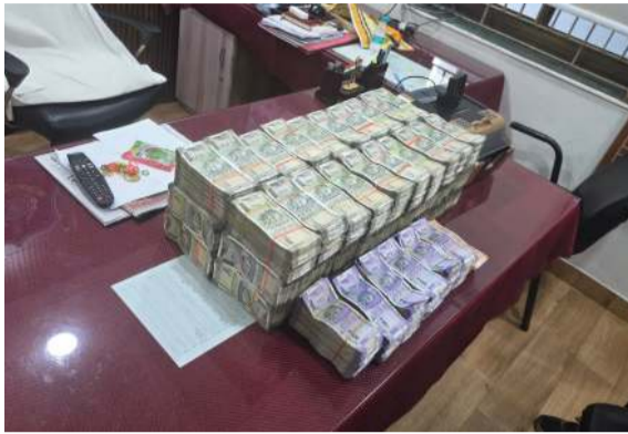
મોટો જથ્થો મળી આવ્યો દાહોની આંગડિયા પેઢીમાંથી આ માતબર રકમ વડોદરા લઈ જવાતી હોવાનો પ્રાથમિક ખુલાસો

આટલી મોટી રકમનો બિનહિસાબી વજથો વડોદરામાં કોને અને કેમ પહોંચાડવાનો હતો તે પોલીસ માટે તપાસનો વિષય બન્યો છે