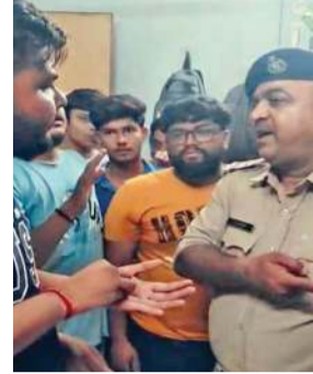
લાવવાને બદલે માત્ર ઠાલા આશ્વાસનો આપવામાં આવતા હોવાનો સ્થાનિકોએ આક્ષેપ કર્યો છે. તેમાંય અધિકારીઓની ગેરહાજરી અને કર્મચારીના

તંત્ર વીજ પુરવઠો ખોરવી નાખે છે, જેના કારણે રોષે ભરાયેલા નાગરિકોએ મધરાતે વીજ કચેરી ગજવી મૂકી હતી. બોરસદમાં છેલ્લા પાંચ દિવસથી વીજ પુરવઠાની કામગીરી સંપૂર્ણપણે કથળી ગઈ છે. દરરોજ રાતે જ્યારે આરામનો સમય હોય છે, ત્યારે જ સતત 3થી 4 કલાક સુધી વીજળી ગુલ કરી દેવામાં આવે છે. એક તરફ પારો 40થી 42 ડિગ્રીને પાર કરી રહ્યો છે, ત્યારે વીજળી વિના નાના બાળકો અને વૃદ્ધોની હાલત અત્યંત કફોડી બની ગઈ છે. વારંવારની રજૂઆતો છતાં તંત્ર દ્વારા કોઈ કાયમી ઉકેલ