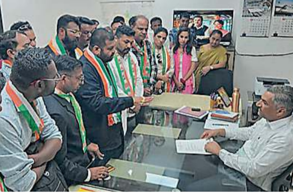
જેટલો સમય વીતવા છતાં નાગરિકો બિસ્માર માર્ગો, સ્ટ્રીટ લાઈટની ખામી અને વરસાદી પાણીના ભરાવા જેવી પાયાની સમસ્યાઓનો સામનો કરી રહ્યા છે. નડિયાદ શહેરમાં ખાસ કરીને સંતરામ મંદિર પાછળનો ભાગ,

(પ્રતિનિધિ) નડિયાદ તા.12 નડિયાદ શહેર કોંગ્રેસ સમિતિ દ્વારા મહાનગરપાલિકાના ઈન્ચાર્જ કમિશનરને આવેલનપત્ર પાઠવી શહેરના પડતર પ્રશ્નો અંગે આક્રમક રજૂઆત કરવામાં આવી છે. નડિયાદને મહાનગરપાલિકાનો દરજ્જો મળ્યાને આશરે દોઢ વર્ષ