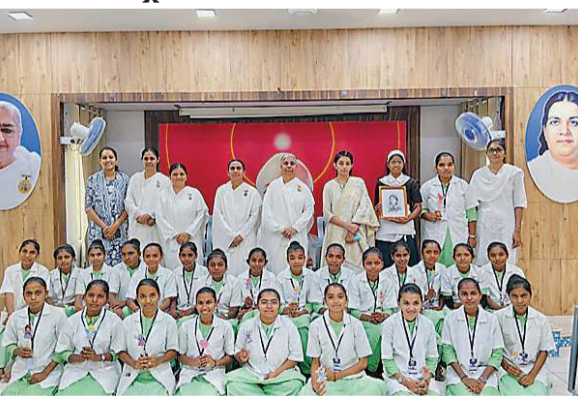
કપડવંજ | કપડવંજની સંકલ્પ કોલેજ ઓફ નર્સિંગના વિદ્યાર્થીઓએ બ્રહ્માકુમારી સેન્ટર ખાતે આંતરરાષ્ટ્રીય નર્સ દિવસની ઉત્સાહભરે ઉજવણી કરી હતી. આ પ્રસંગે બ્રહ્માકુમારી સંસ્થા દ્વારા આરોગ્ય ક્ષેત્રે નર્સોની નિરંતર સેવા અને તેમના અમૂલ્ય યોગદાનની વિશેષ પ્રશંસા કરવામાં આવી હતી. આ કાર્યક્રમમાં બ્રહ્માકુમારી બહેનો દ્વારા વિદ્યાર્થીઓને સકારાત્મક જીવનશૈલી અને માનસિક શાંતિ જાળવવા અંગે પ્રેરક માર્ગદર્શન આપવામાં આવ્યું હતું. આ કાર્યક્રમના અંતે, નર્સોની સમર્પિત સેવા બદલ તેમને અભિનંદન પાઠવી સન્માનિત કરવામાં આવ્યા હતા.