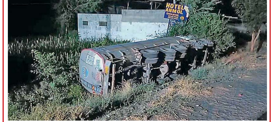
અમદાવાદ-વડોદરા નેશનલ હાઈવે 48 પર દાવડા બ્રિજ પાસે ગત રાત્રિએ એક ટેન્કર 20 ફૂટ ઊંડા ખાડામાં ખાબક્યું હતું. વડોદરાથી અમદાવાદ જ રહેલા આ ટેન્કરમાં અંદાજે 30 હજાર લીટર અતિ જ્વલનશીલ એમએમએ કેમિકલ ભરેલું હતું. આ અકસ્માત બાદ કેમિકલ લીકેજ શરૂ થતા આગ લાગવાની ભીતિ વચ્ચે નડિયાદ ફાયર બ્રિગેડે તાત્કાલિક પાણીનો મારો ચલાવ્યો હતો. આ ઘટના સ્થળે ગાંધી મામલતદાર, હાઈવે પેટ્રોલિંગ અને પોલીસનો કાફલો તેનાત કરી વિસ્તારને સુરક્ષિત કરવામાં આવ્યો હતો. વડોદરા રિફાઈનરીની ટેકનિકલ ટીમ દ્વારા ટેન્કરમાંથી વધેલું કેમિકલ ઝીખ ટેન્કરમાં રિફિલિંગ કરવાની કામગીરી હાથ ધરાઈ છે. જ્યારે ઘર્ષણથી તણખલા ન ઝટે તે માટે ફાયર વિભાગ દ્વારા સતત પાણીનો છંટકાવ કરીને વિશેષ તકેદારી રાખવામાં આવી રહી છે.