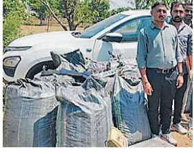
કારચાલક અને તેનો સાથીદાર અંધારાનો લાભ લઈ ગાડી મૂકીને ફરાર થઈ ગયા હતા. સંતરામપુર પોલીસને ગત રાત્રે આશરે 10 વાગ્યાના અરસામાં

(પ્રતિનિધિ) સંતરામપુર તા.12 સંતરામપુર પોલીસ હદના સરસણ આઉટપોસ્ટ વિસ્તારમાં ગત રાત્રે પોલીસે ભાતમીના આધારે એક શંકાસ્પદ કારનો પીછો કરીને તેમાંથી અંદાજે 250 કિલો નશીલો પદાર્થ ગાંજો જપ્ત કર્યો છે. પોલીસની સક્રિયતા જોઈ