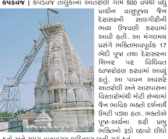
કપડવંજ | કપડવંજ તાલુકાના આતરોલી ગામે 500 વર્ષથી વધુ પ્રાચીન વાસુપૂજ્ય જૈન દેરાસરની સાલગીરીની ભવ્ય ઉજવણી કરવામાં આવી હતી. આ મંગલમય પ્રસંગે ભક્તિભાવપૂર્વક 17 મેદી પૂજા તથા દેરાસરના શિખર પર વિદિવત દવજારોહણ કરવામાં આવ્યું હતું. આ પાવન અવસરે આતરોલી અને આસપાસના વિસ્તારમાંથી મોટી સંખ્યામાં જૈન ભાવિક ભક્તો દર્શનાર્થે ઉમટી પડ્યા હતા. ભક્તોએ પૂજા-અર્ચના કરી પ્રભુ ભક્તિનો રૂડો લ્હાવો લીધો હતો અને સમય વાતાવરણ ભક્તિમય બની ગયું હતું.