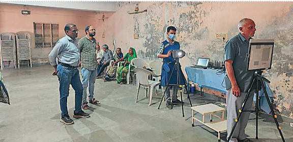
ખેડા | ખેડા સીડીએચઓના માર્ગદર્શન હેઠળ પ્રાથમિક આરોગ્ય કેન્દ્ર સિહુજ અને વાંઠવાડી ખાતે ટીબી મુક્ત ભારતના 100 દિવસીય અભિયાન અંતર્ગત વિશેષ તપાસ કેમ્પનું આયોજન કરવામાં આવ્યું હતું. આ કેમ્પમાં કુલ 336 દર્દીઓના એક્સ-રે પાડવામાં આવ્યા હતા, જેમાં ખાસ કરીને 60 વર્ષથી વધુ વયના, ડાયાબિટીસ ધરાવતા અને ધૂમ્રપાન કરતા વ્યક્તિઓની સઘન તપાસ કરાઈ હતી. ટીબી નિદાનની સાથે દર્દીઓનું એનસીસી સ્ક્રીનિંગ, એચબી ચેકઅપ અને જરૂરી દવાઓનું વિતરણ કરી યોગ્ય રેફરન્સ પણ આપવામાં આવ્યા હતાં. તાલુકા આરોગ્ય સુપરવાઇઝરની ઉપસ્થિતિમાં વાંઠવાડી આરોગ્ય ટીમના કર્મચારીઓએ ખડપેગે હાજર રહીને આ સેવા કેમ્પમાં પોતાની ફરજ બજાવી હતી.