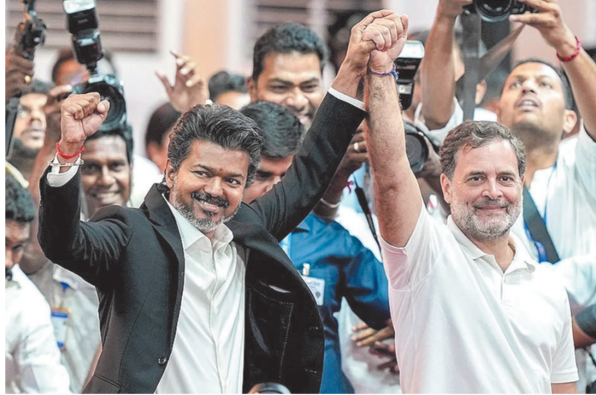
જેણે રાજ્યમાં દાયકાઓથી ચાલી રહેલા DMK અને AIADMKના (તમિલગ વેટ્ટી કઝગમ) સૌથી મોટા પક્ષ તરીકે ઉભરી આવી છે, આયોજિત સમારોહમાં રાજ્યપાલ રાજેન્દ્ર વિશ્વનાથ આર્લેકરે 'બુસી' એન. આનંદ, આધવ અર્જુન અને કે. એ. સેન્ગોક્ષિયનને પણ મંત્રી તરીકે પદના શપથ લેવાડાયા હતા. આ શપથ ગ્રહણ સમારોહમાં કોંગ્રેસના નેતા રાહુલ ગાંધી સહિતના વરિષ્ઠ ... અનુસંધાન પાના 2 પર