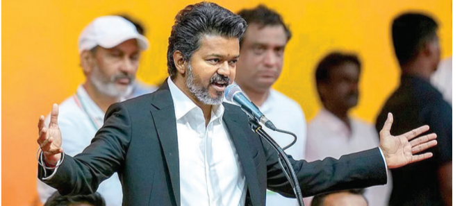
આ બાબુ એક પાવર સેન્ટર, બીજી બાબુ બીજું એવું નહીં હોય