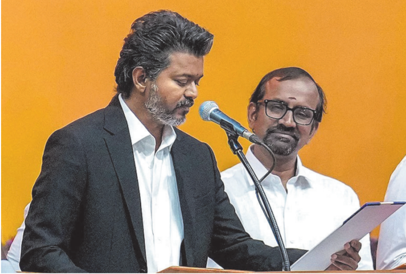
તામિલનાડુના રાજકારણમાં વિજયનું આ સર્વોચ્ચ પદ પર આગમન એક મહત્વપૂર્ણ અને ઐતિહાસિક પરિવર્તન સૂચવે છે.

ચેન્નાઈ, તા. ૧૦ (PTI): ઉમટી પહેલી પ્રચંડ જનમેદનીના હર્ષનાદ અને વધામણાં વચ્ચે, સી. જોસેફ વિજયે રવિવારે તમિલનાડુના મુખ્યમંત્રી તરીકે શપથ ગ્રહણ કર્યા હતા. તેમણે પ્રતિજ્ઞા લેતા જણાવ્યું હતું કે, સાચા બિનસંપ્રદાયિક સામાજિક ન્યાયના એક નવા યુગની શરૂઆત હવે થાય છે.