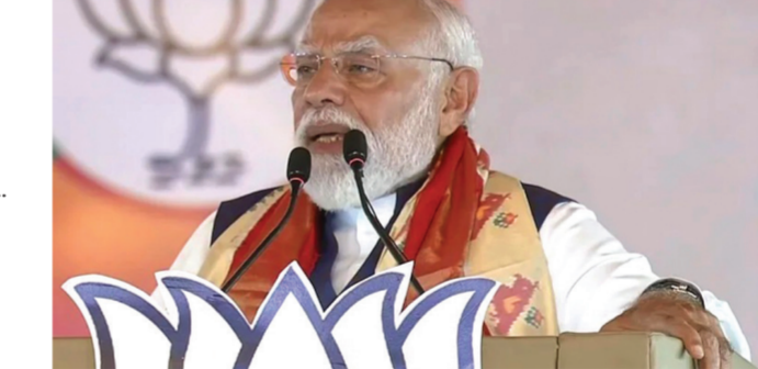
કોરોના કાળમાં આપણે અપનાવેલી સિસ્ટમ ફરી શરૂ કરવાનો આ સમય છે : મોદી

ઉર્જા સંરક્ષણ પર ભાર મૂકી વડાપ્રધાને કહ્યું, દેશને વૈશ્વિક ઉર્જા સંકટમાંથી બહાર કાઢવાની પહેલો ચાલુ છે આચારી ઉર્જા સંસાધનોનો ઉપયોગ વિવેકપૂર્ણ રીતે અને માત્ર જરૂર હોય ત્યારે જ કરવો જોઈએ : મોદી હેરાબાદ, 10 (PTI): વડાપ્રધાન નરેન્દ્ર મોદીએ રવિવારે જણાવ્યું હતું કે, પશ્ચિમ એશિયાના સંકટને ધ્યાનમાં રાખીને સમયની માંગ છે કે પેટ્રોલિયમ પેદાશોનો ઉપયોગ વિવેકપૂર્ણ રીતે કરવામાં આવે. તેલગણાણમાં આશરે ૮,૪૦૦ કરોડના વિકાસ પ્રોજેક્ટ્સનું વચ્ચુંઅલ રીતે શિલાન્યાસ અને ઉદ્ઘાટન કાર્યક્રમમાં ભોલતા મોદીએ લોકોને આ અપીલ કરી હતી. ... અનુસંધાન પાના 2 પર