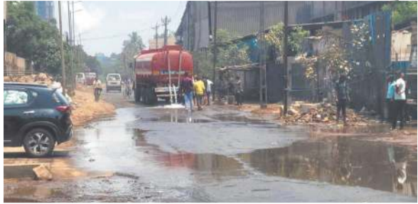
વાપી : વાપી જીઆઈડીસીના થર્ડ ફેઈઝમાં મોડી રાત્રે એચસીએલ એસિડની ટેન્ક ફાટતા અકરાતકરીનો માહોલ સર્જાયો હતો. રાત્રે જોરદાર અવાજ સાથે ટેન્ક ફાટતા રસ્તા ઉપર એસિડ ફેલાતા સફેદ ધૂમાડો પ્રસરી ગયો હતો. આ બનાવ

શેઠ એન્ટરપ્રાઇઝના ટેન્કરમાંથી HCL એસિડ લીક થતા GPCBએ નમૂના લઈ તપાસનો દામદમાટ શરૂ કર્યો