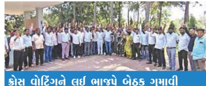
કોસ વોર્ટિંગને લઈ ભાજપે બેઠક ગુમાવી

બંને તાલુકા પંચાયતોમાં પ્રમુખ પદ માટે પ્રદેશ કક્ષાએથી નિર્ણય : ધારાસભ્ય