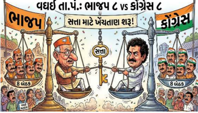
વઘઈ તા.પં.: ભાજપ ૮ vs કોંગ્રેસ ૮ સત્તા માટે ખેંચતાણ શરૂ!

સાપુતારા : ડાંગ જિલ્લાના વઘઈ તાલુકા પંચાયતમાં સત્તાનું સમીકરણ ભારે રસાક્ષીભર્યું બન્યું છે. વઘઈ તાલુકા પંચાયતની કુલ ૧૬ બેઠકોના પરિણામો જાહેર થતા ભાજપને ૮ અને કોંગ્રેસને ૮ બેઠકો મળી છે, જેના કારણે અહીં સત્તા માટે 'ટાઈ-ટી' સ્થિતિ સર્જાઈ છે. આ પરિણામોએ બંને પક્ષોની ઉંઘ હરામ કરી દીધી છે અને હવે સત્તાના સૂત્રો કોણ સંભાળશે તે માટે જોરદાર ખેંચતાણ શરૂ થઈ છે. વિશ્વસનીય સૂત્રો પાસેથી મળતી માહિતી મુજબ, વઘઈમાં ટાઈ પડતા જ 'હોર્સ ટ્રેડિંગ' કે તોડજોડની આરાંકાએ બંને પક્ષો