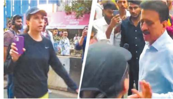
મુંબઈમાં ભાજપની રેલીથી કંટાળેલી મહિલા મંત્રી પર વરસી પડી

મહિલાઓના અધિકારની રેલીમાં જ મહિલા પરેશાન! મુંબઈમાં ભાજપની રેલીથી કંટાળેલી મહિલા મંત્રી પર વરસી પડી 'અહીંથી નીકળી જાવ, ટ્રાફિક જામ કેમ કરો છો': મહિલાએ મંત્રીને ખપડાવ્યા, સોશિયલ મીડિયા પર વીડિયો વાયરલ: વિપક્ષે મહિલાને 'સારી નારી શક્તિ' ગણાવી મુંબઈ, તા. ૨૨ (PTI): મુંબઈના વરલી વિસ્તારમાં મંગળવારે ભાજપ દ્વારા આયોજિત 'મહિલા જનઆકોશ મોરચા' દરમિયાન ભારે ટ્રાફિક જામ સર્જીને અકબચાબના પિત્તો ગયો હતો. પોતાના ભાષકને લેવા જઈ રહેલી આ મહિલા ક્લાકો સુધી ટ્રાફિકમાં ફસાયેલી રહી હતી. આખરે ગુસ્સે ભરાયેલી મહિલાએ ગાડીમાંથી ઉતરીને સીધા જ મહારાષ્ટ્રના મંત્રી ગિરીશ મહાજન અને પોલીસ અધિકારીઓની ઉપર લીધો હતો. આ ઘટનાનો વીડિયો સોશિયલ ...અનુસંધાન પાના ૧૧ પર