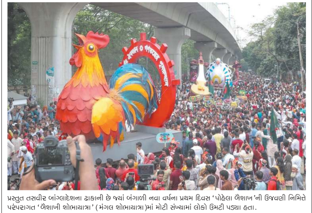
પ્રસ્તુત તસવીર બાંગ્લાદેશના ડાકાની છે જ્યાં બંગાળી નવા વર્ણના પ્રથમ દિવસ 'પોહેલા બૈશાખ'ની ઉજવણી નિમિત્તે પરંપરાગત 'બૈશાખી શોભાયાત્રા' (મંગલ શોભાયાત્રા)માં મોટી સંખ્યામાં લોકો ઉમટી પડ્યા હતા.

પાકિસ્તાન આઈએમએફ પાસેથી 1.3 અબજ ડોલરનો આગામી હપ્તો મળવાની આશા છે જેનાથી તેને થોડી રાહત મળશે. નાણા મંત્રીએ માન્યું હતું કે જો ટૂંક સમયમાં ભંડોળની વ્યવસ્થા નહીં થાય તો પાકિસ્તાન ફરીથી ડિકોલ્ટર બની શકે છે. પાકિસ્તાન 'પાન્ડા બોન્ડ્સ' (ચીની ચલણ યુઆનમાં દેવું) અને યુરોબોન્ડ્સ જેવા વિકલ્પો પર વિચાર કરી રહ્યા છે. નિષ્ણાતોનું માનવું છે કે પાકિસ્તાન અંને સાઉદી અરબિયા વચ્ચે વધતી નિકટતાથી યુએઈ નારાજ હોઈ શકે છે, જેના કારણે તેણે અચાનક નાણાં પાછા માગ્યા છે.