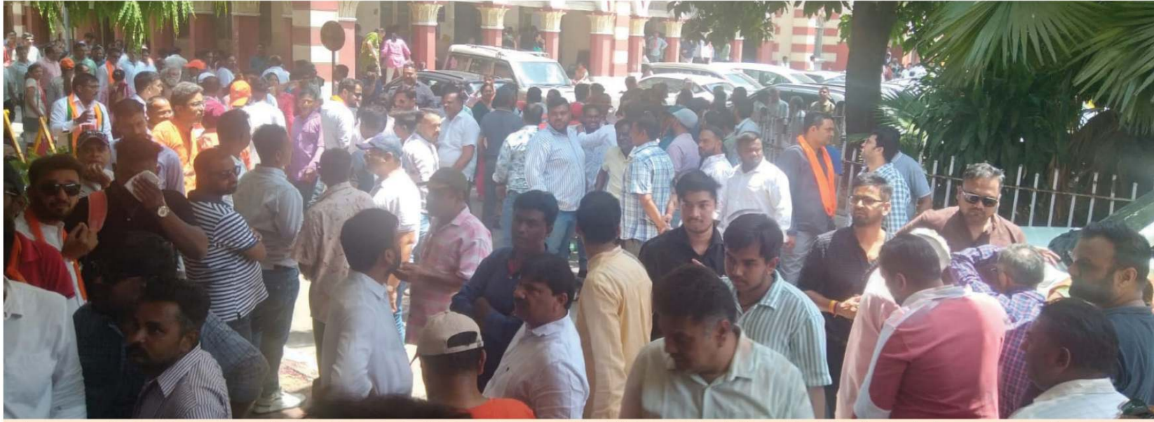
વડોદરા મહાનગર પાલિકાની ચૂંટણીના જંગમાં હવે રસાકસી જામી છે. ફોર્મ ભરવાના અંતિમ દિવસે વિવિધ પક્ષોના તથા અપક્ષ ઉમેદવારોએ પોતાના સમર્થકો સાથે કલેક્ટર કચેરી ખાતે ઉમેદવારી પત્રો ભર્યા કર્યા હતા.