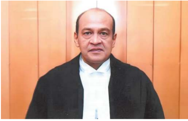
તેમના દિલ્હી સ્થિત નિવાસસ્થાનેથી મળેલા ચલણી નોટોના બંડલ મળી આવ્યા બાદ ભ્રષ્ટાચારના આરોપો

જો કે તેમના ઘરેથી મળેલી સળગેલી ચલણી નોટોના કેસમાં હવે ફોજદારી કાર્યવાહીનો સામનો કરવો પડી શકે